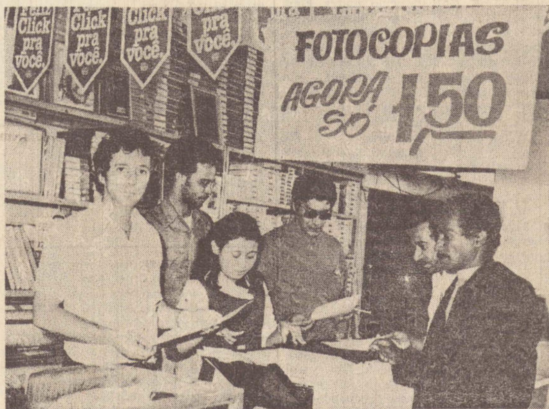
FOTO MODERNO IMPLANTA O SISTEMA DE CÓPIAS NASHUA 1.220-S

O FOTO MODERNO, à rua Tenente Nicolau Maffei, 204, em Presidente Prudente, passa a oferecer a seus clientes e amigos, as mais perfeitas cópias, proporcionadas pela aquisição do mais moderno equipamento de cópias existente atualmente no mercado. Na foto, flagrante da instalação do equipamento NASHUA, 220-S pela ORGANIZAÇÃO CONTA — MEC LTDA. REPRESENTANTE EXCLUSIVA NASHUA