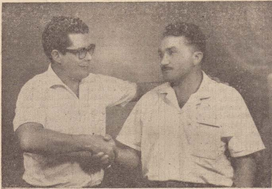
Tipo do apêto de mão que fez dois cidadãos verem ESTRÊLA...