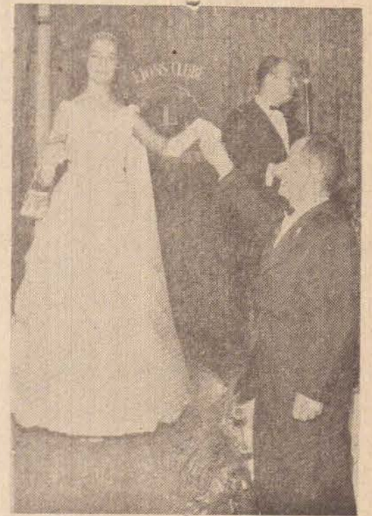
A 2 de julho próximo dar-se-á nos salões da APEA, a promoção de Lions Clube, edição 1966, do tradicional BAILE DAS DEBUTANTES. E' acontecimento que tem por objetivo, afóra o sentido filantropico que sempre o norteou, apresentar a sociedade, às menina-moças de então, que pela vez primeira adentram ao convívio social. Via de regra tem sido um espetáculo magnifico aos olhos e ao coração. Em 1966, não será diferente, e ilustrando a nossa página com um flagrante de um desses bailes, pretendemos, tão somente, cumprimentar os "leões" prudentinos pelo trabalho que já se inicia, bem como solicitar as famílias de Presidente Prudente uma adesão a essa festa, quer prestigiando-a, quer apresentando suas filhas, para esse evento tão grato.

Círculos políticos paulistas afirmam que o projeto de instituição do Título de Cidadão Paulista ao marçal Castelo Branco, é um teste para verificar se ainda estão vigorando os esquemas que derrotaram a ARENA nas eleições para a Mesa do Legislativo. Recordar-se, que até hoje apenas três pessoas receberam o título, sendo eles: Rubem Berta (presidente da Varig), Juscelino Kubitschek e Alexandre Fleming (descobridor da pini-cilina).