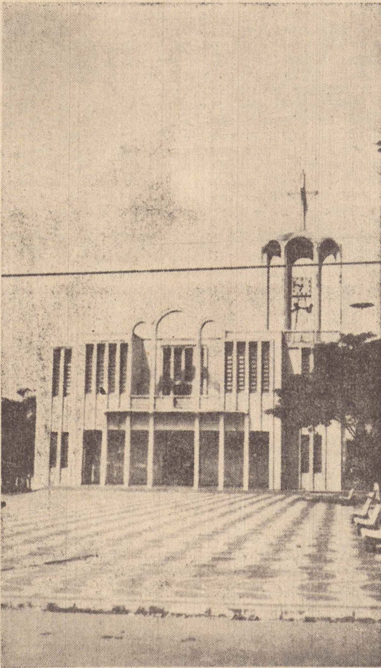
O belo templo erigido no centro de Mirante

No momento atual, com o mesmo espírito colaborador do passado, os mirantenses es-