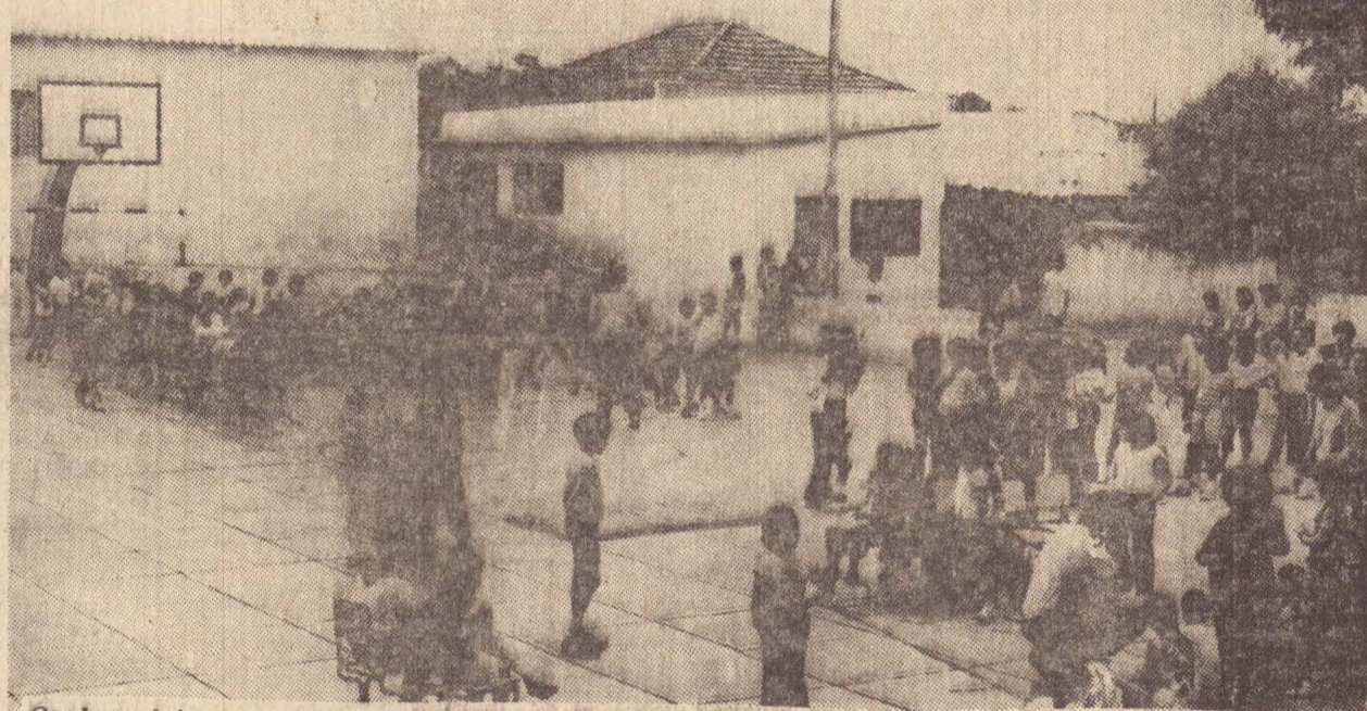
Os alunos brincaram, dançaram, pularam e se divertiram bastante, com os alunos da Educação Física do Imespp

sidente Epitácio. Ainda foram seguidos por um dos clientes do banco, mas não foram alcançados. A Polícia armou um cerco ontem em toda a região, mas até à noite, não havia conseguido nenhum resultado positivo. (Mais detalhes, na página 9).