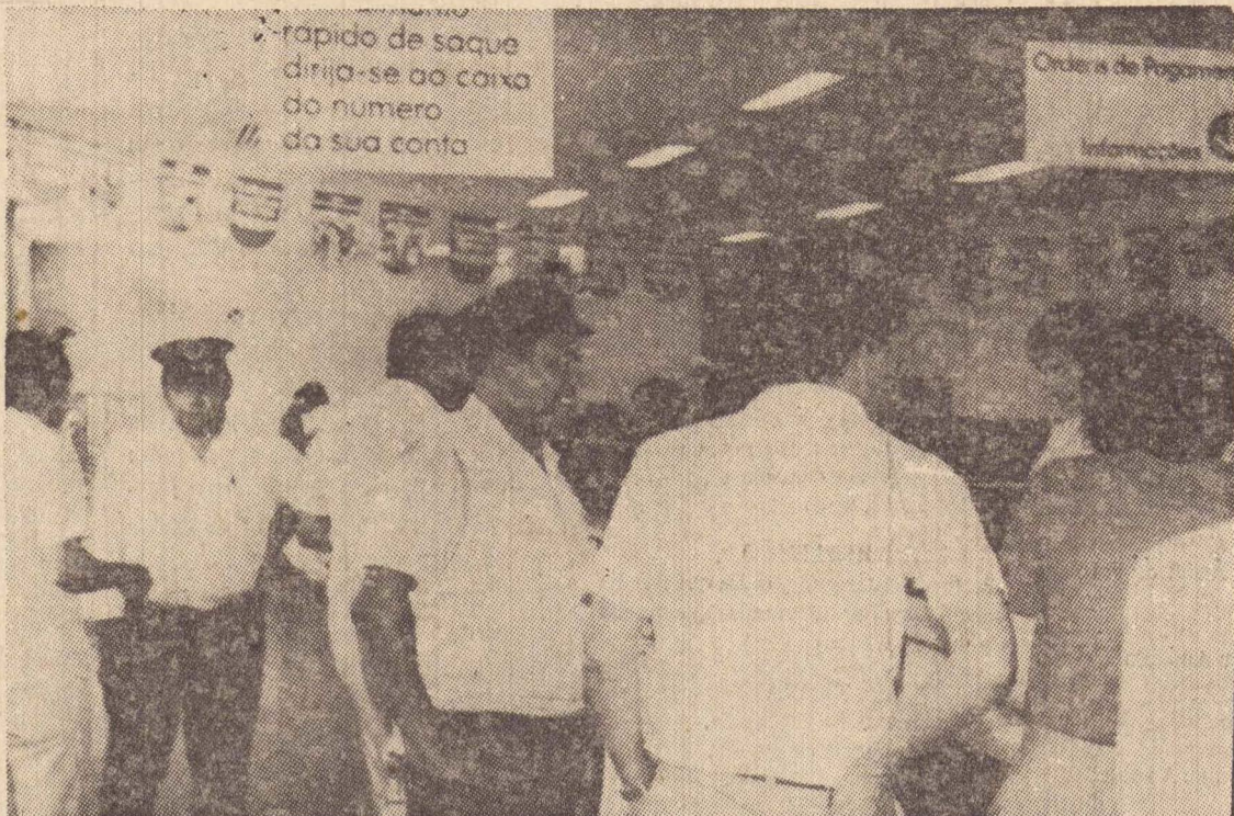
Depois do assalto, além da Polícia, muita gente foi até o banco saber o que havia acontecido

Mantida em absoluto sigilo pela direção da Petrobrás, a notícia deverá ser divulgada no início da próxima semana, da mesma forma como a informação de que as reservas prováveis de gás natural na Amazonia, antes estimadas entre 60 a 80 bilhões de metros cúbicos, subiram para 120 bilhões de metros cúbicos, com base nas últimas descobertas na região. As atuais reservas brasileiras de gás, sem contar o volume existente na Amazonia, são de cerca de 73 bilhões de metros cúbicos. Assim, o gás natural existente na região do Juruá, no Alto Amazonas, poderia justificar seu aproveitamento comercial.