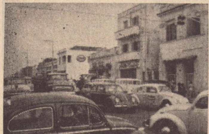
No cruzamento da rua Barão do Rio Branco com a Avenida Brasil, foi implantado um sinaleiro e em seguida retirado. Até quando?

Enquanto isso, agrava-se o problema do estacionamento nas ruas centrais, especialmente às 2.ªs e 6.ªs feiras, quando há maior fluxo de veículos no setor comercial. Os congestionamentos são constantes e a crise se agrava a cada dia que passa.