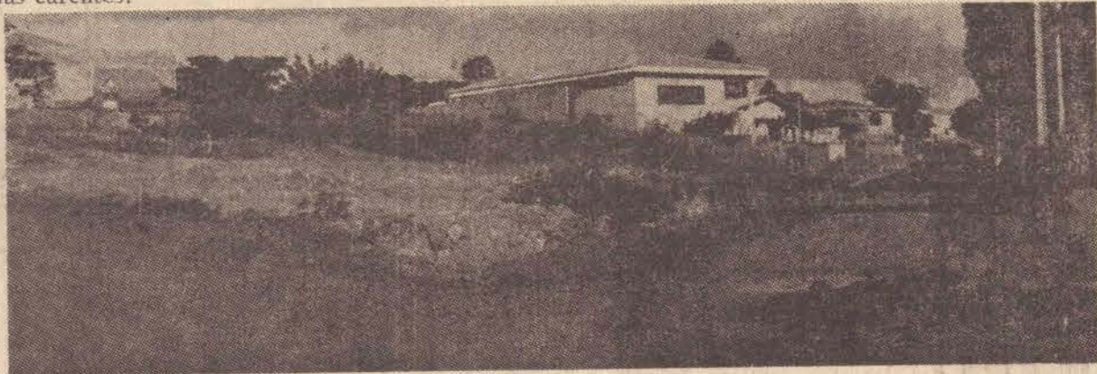
A Prudente vai iniciar a pavimentação da pista norte e as ligações com varias ruas.