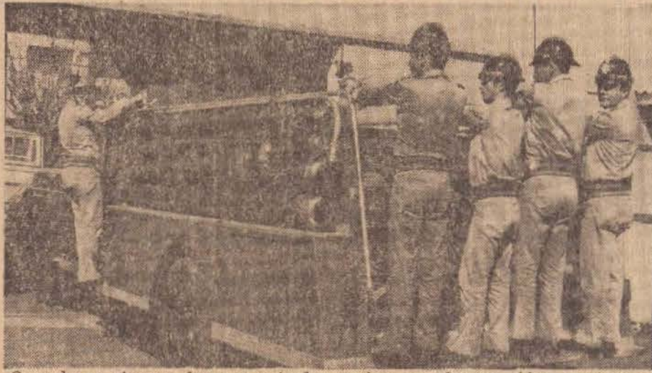
Quando as sirenes de seus veiculos estiverem abertas, dão passagem aos intrépidos homens do fogo.

Assim é que, em desabamentos, inundações, afogamentos, enfim tudo que ofereça pe-