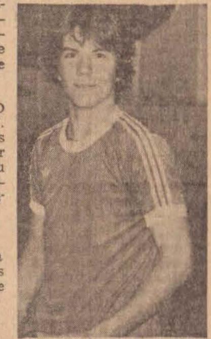
Mescolote, basquete masculino