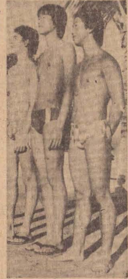
Integrantes da equipe de natação