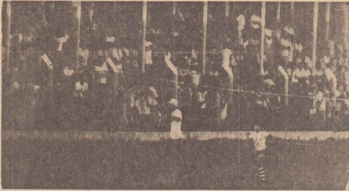
Um grande público para ver o treino santista.