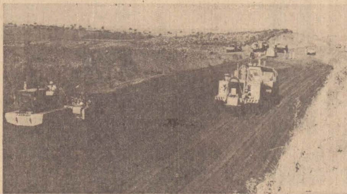
Estas obras mudarão a paisagem regional e ativarão sua vida econômica.