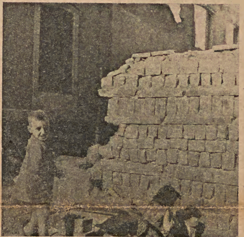
Madrid, en tiempos heroicos en que se luchaba y moría contra el invasor franquista, en los parapetos, sin que los niños interrumpieran sus juegos.

A la vista de estos datos, que representen un verdadero plebiscito, aunque limitado, la primera consulta sería, auténtica, a un sector del país, ¿qué aguardan los espúreos gobernantes franquistas para hacer sus maletas? ¿Quieren más pruebas de la impopularidad bochornosa del régimen sangriento de Franco los observadores internacionales? Pues no hay más que extender la consulta a la clase obrera y al pueblo español en general, fábrica por fábrica, barrio por barrio, cárcel por cárcel, presidio por presidio. No cabe duda de que el resultado montaría en flecha por su significación meridiana y contundente.