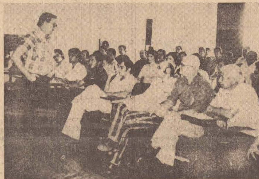
Flagrante tomado durante a abertura do curso

plementado por completa orientação dada aos contadores municipais.