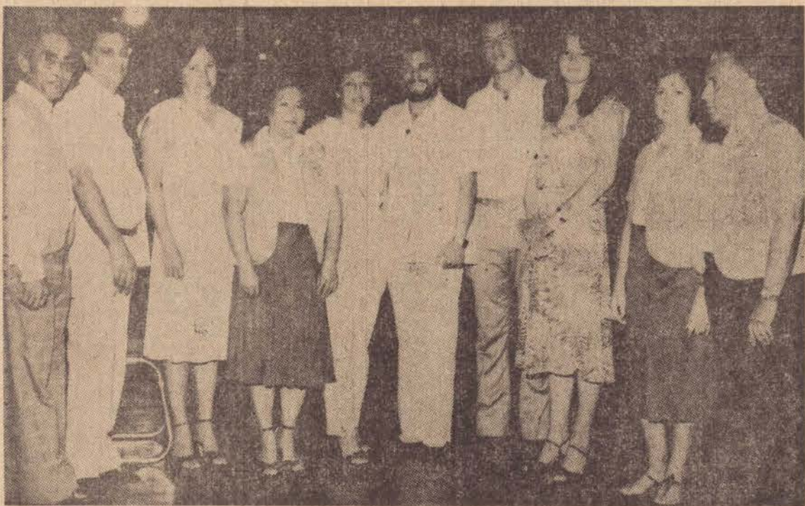
Os novos companheiros que integram o clube com suas domadoras, entre seus respectivos padrinhos.