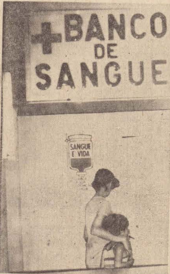
O Banco de Sangue João XXIII, da Santa Casa de Misericórdia, não aceita a figura do doador profissional.

Doar sangue, é dividir com outro um pouco da própria vida, demonstrando a magnitude de um coração altruista. A definição, visa valorizar a figura do doador de sangue voluntário, cada vez mais raro, embora cada vez mais os hospitais necessitem de sangue, sendo que isto é motivo, inclusive, para uma campanha do governo de caráter nacional.