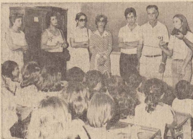
O prefeito "Ditão", e seus assessores, foram conhecer o que faz a EEPSP Tanel Abud, no setor de merenda escolar (foto)

SEMANA DA MERENDA ESCOLAR Isto ocorre exatamente no início da "Semana da Merenda Es-