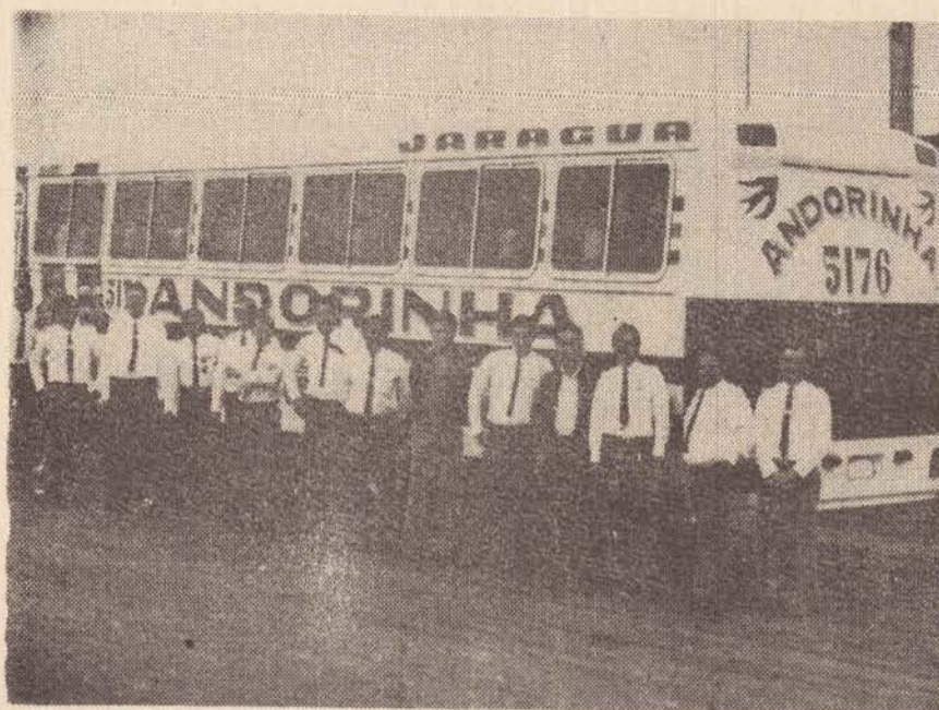
Os valorosos motoristas da Andorinha, responsáveis pela segurança de milhares de passageiros que transitam pelos estados do Amazonas e Mato Grosso. A eles a homenagem pelo zelo e cuidados que dedicam nos longos trajetos percorridos.