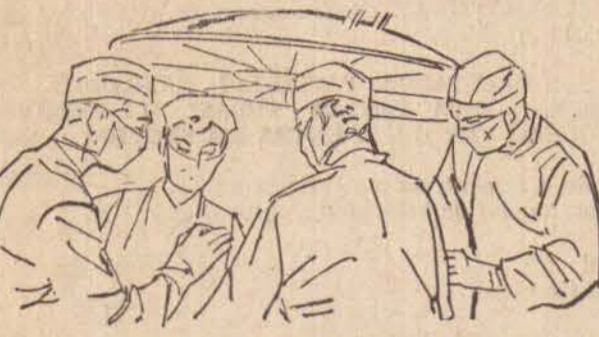
CIRURGIA GERAL - (operações)

São Paulo — SSI — Um aparelho com a sensibilidade de um oscilógrafo e que registra as mínimas pulsações do coração vem de ser desenvolvido na República Federal da Alemanha. O registrador das pulsações do coração "Teldicord" tem a sensibilidade de um oscilógrafo e registra as mínimas pulsações. O aparelho de transistores, do tamanho de um rádio de bolso, e de fácil manejo, podendo por isso, ser utilizado por policiais, bombeiros e enfermeiros. O "Teldicord" capta as diferenças de tensão originadas pela ação do coração, reforça estas correntes e transformando-as em impulsos de som. Em vista do elevado número de acidentes, o aparelho construído por uma firma de Heidelberg terá dentro em breve o seu lugar em todas as ambulâncias e rádio-patrolhas, nas salas de operações e nas malas de médicos.