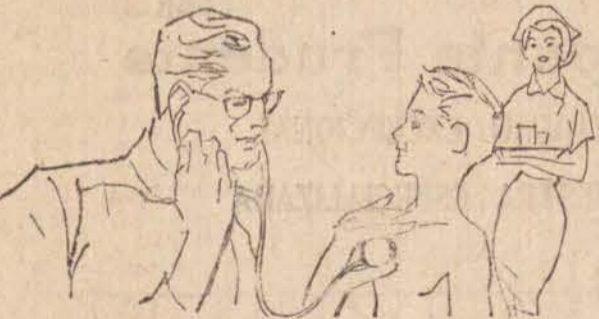
PEDIATRIA — (Moléstias de Crianças)

CIRURGIA GERAL E GINECOLÓGICA CLÍNICA DE SENHORAS RUA: SIQUEIRA CAMPOS, 810 TEL/ 3248 — A NOITE 3022