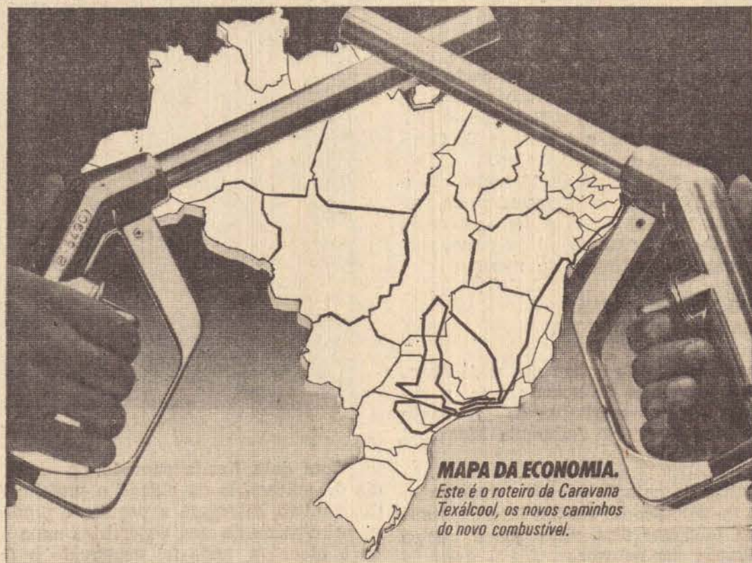
MAPA DA ECONOMIA. Este é o roteiro da Caravana Texácool, os novos caminhos do novo combustível.

A Caravana Texácool chega a esta cidade pra comemorar os 65 anos da Texaco no Brasil. Como a palavra de ordem é economia, ela está somando 65.000 km de Brasil, inteirinhos a álcool. De ponta à ponta, utilizando óleos lubrificantes Texaco já aprovados pela indústria automobilística para motores a álcool, e testando outros desenvolvidos especificamente para o novo combustível. A Caravana Texácool é um apoio ao Pró-Alcool, uma iniciativa totalmente brasileira de incentivo ao uso de fontes alternativas