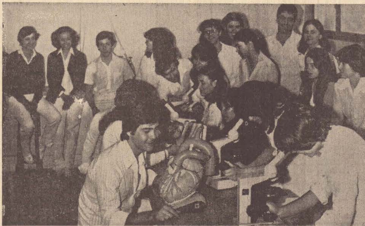
Um aspecto da aula do curso de fisioterapia.