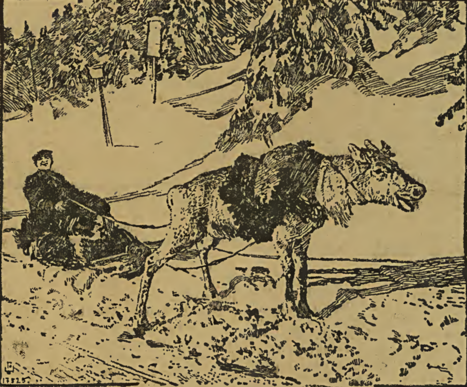
Reintierpost im Satz. Die erste Reintierpost in Deutschland wurde jetzt im Satz eröffnet. Man ließ sich ein Reintierpaar und zwei Pappänder kommen und befördert jetzt mit diesem eigenartigen Schlitten- gepann täglich die Briefpost von Schierke auf den Broden und zurück.