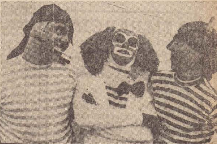
As figuras de "Um Gato... e um rato".

Com as características de uma revista, a peça possui todos os elementos que permitem sua perfeita comunicação com a criança, proporcionando uma participação ativa, natural e inteligente, que não precisa de gritos, correrias, crianças no palco ou atores na plateia.