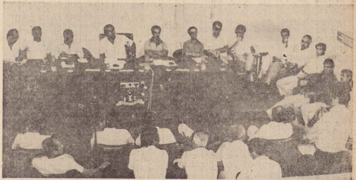
Prefeitos da 10.a e 11.a regiões administrativas estiveram em Presidente Prudente.

forme tabela específica. O acordado estabelece garantia do mesmo salário ao empregado substituto abono de faltas ao trabalhador estudante, para a prestação de exames escolares, devidamente comprovados, e obrigatoriedade de o empregador fornecer a seus empregados comprovantes de pagamento contendo sua identificação e, discriminadamente, a natureza dos valores das importâncias pagas e descontos efetuados, inclusive dos depósitos do fundo de garantia por tempo de serviço.