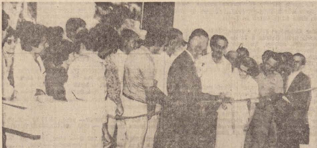
O momento em que era desatada a fita simbólica, marcando a inauguração das magníficas instalações da "Nossa Caixa", em Presidente Prudente.