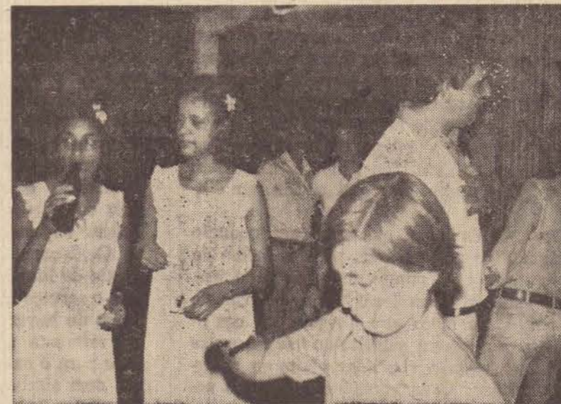
Familiares de funcionários da organização anfitriã viveram algumas horas de lazer e euforia, num conagraçamento de caráter muito sensitivo, promovido pelo grupo Pontalti. Especialmente as crianças e adolescentes foram os destaques daquele evento.