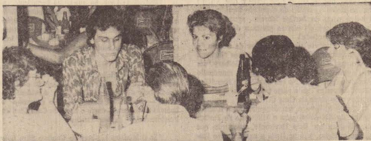
A churrascada, regada a cervejas e refrigerantes, desenvolveu-se num clima de muita animação, como se pode observar neste flagrante colhido no ultimo sábado nas dependências de Pontalti — Utilidades Domésticas Ltda..

O complexo empresarial do grupo Pontalti, localizado na Vila Jesus — antigas instalações da Anderson Clayton & Co. — no ultimo sábado, dia 5, recebeu perto de 450 convidados para a sua festa de conagraçamento anual, marcando o encerramento de mais um ano de proficuas atividades. Os presentes, em sua maioria, eram funcionários e familiares integrantes das catorze lojas da tradicional organização de eletrodomésticos, sendo servido no local uma churrascada no melhor estilo.