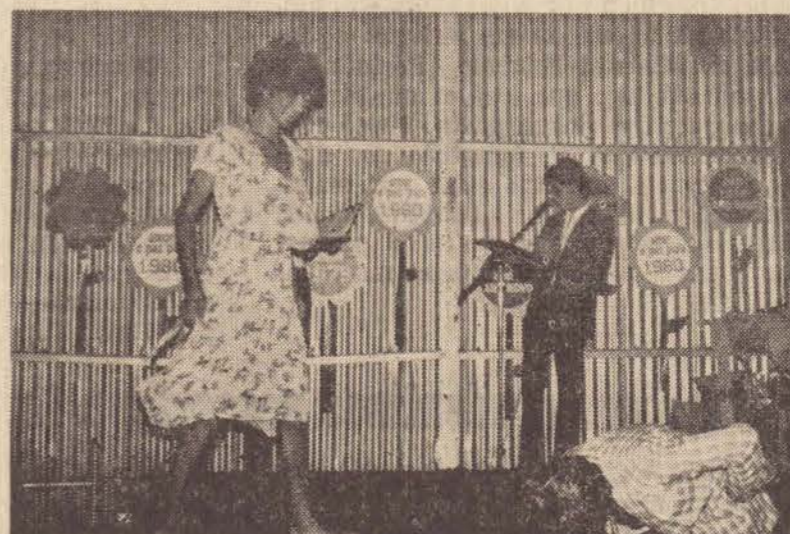
Os funcionários da organização Pontalti demonstraram muita criatividade, na promoção de Vemos um desfile de modas "sui generis", com o "manequim" exigindo um costume da época e sendo hilariamente aplaudido.