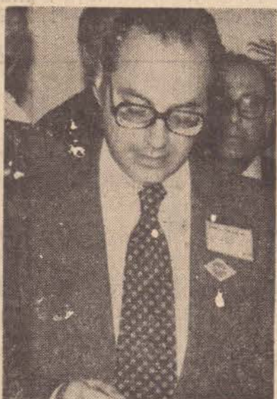
Maluf: com muito dinheiro para gastar

BRASÍLIA (AE) — Os Ministros de Estado terão a partir de fevereiro um novo vizinho. Trata-se do ex-governador Paulo Salim Maluf, de São Paulo, que para residir em Brasília e exercer o mandato de deputado federal alugou a mansão número um da quadra 12 da Península dos Ministros, no lado sul, pela qual deverá pagar de aluguel 1 milhão 300 mil por mês.