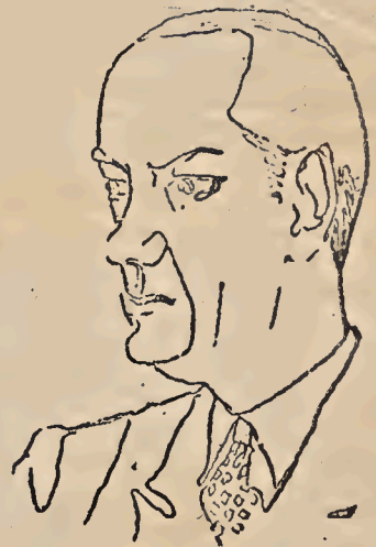
Camilo José Cela

La poesía catalana, al urbanizarse con Margall, perdió riqueza