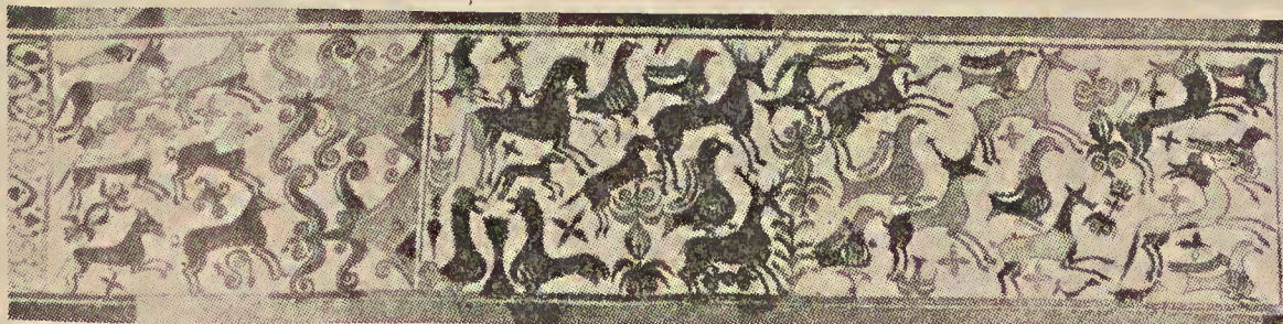
Cabezo de Alcalá (Azaila). Estilo clásico de Azaila. Decoraciones del período E2 (post-sertoriano 77-43 a.d.n.E.). De Cabré, Corpus, Azaila.)

Desde el período D comienza la evolución del estilo de Azaila que se prolonga hasta muy tarde y precisamente en todo su esplendor, cuando en otras regiones de la cerámica ibérica ésta ha desaparecido o se halla en sus últimas etapas de decadencia. Después de una primera etapa, D I, en que todavía la cerámica de Azaila no es sino un reflejo enriquecido y barroco de los motivos de la hoja de yedra «exenta» de Sidamunt (122) y de la guirnalda de hojas