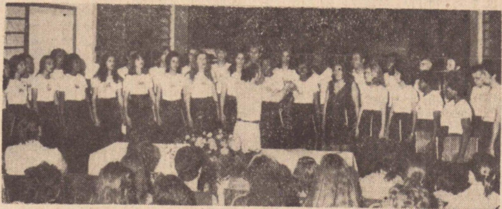
O Coral Villa-Lobos apresentando sua audição.

Foi realizada terça-feira última a solenidade de posse da diretoria do Diretório Acadêmico "Alberto Deodato" da Faculdade de Ciências, Letras e Educação da Associação Prudentina de Educação e Cultura.