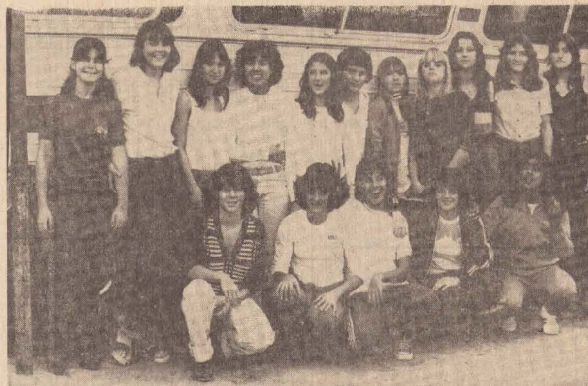
Aspecto da chegada de um grupo de atletas da delegação prudentina, em Marília.

O aspecto meramente turístico da representação de Presidente Prudente nos Jogos Regionais desapareceu, segundo a filosofia de trabalho imprimida pela Autarquia Municipal de Esportes.