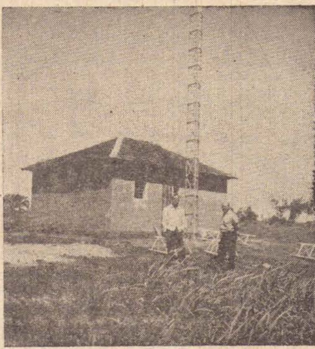
A FOTO E' O FATO

E possível que os trabalhos prossigam até o fim do corrente mês, ou então por mais o mês inteiro de março, confirmação que se aguarda de um momento para outro.