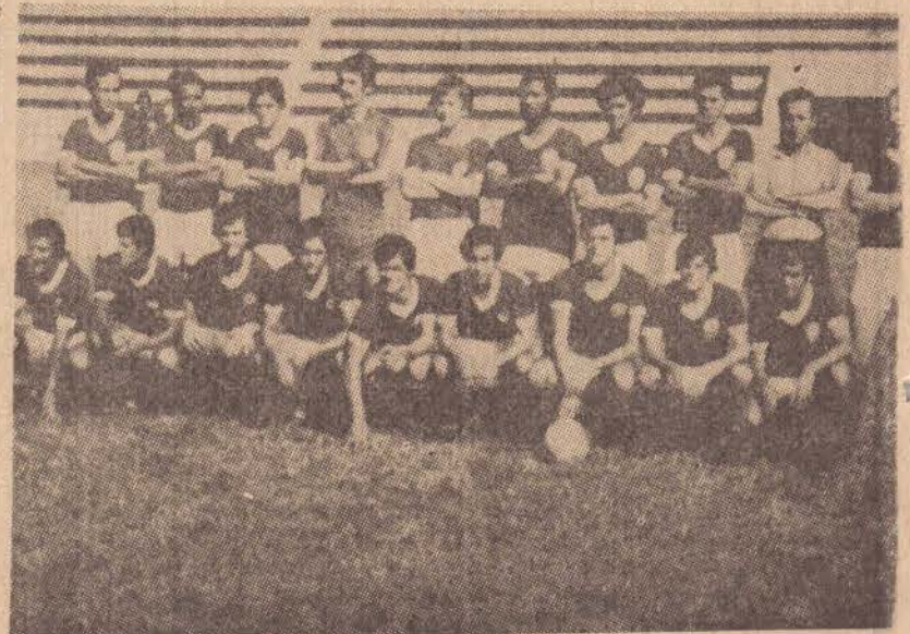
Equipe da S.E. Palmeiras de Regente Feijó, campeã do Torneio Mini Copa.

As equipes campeã e vice os cumprimentos do Departamento de Esportes Amadores do Jornal O Imparcial.