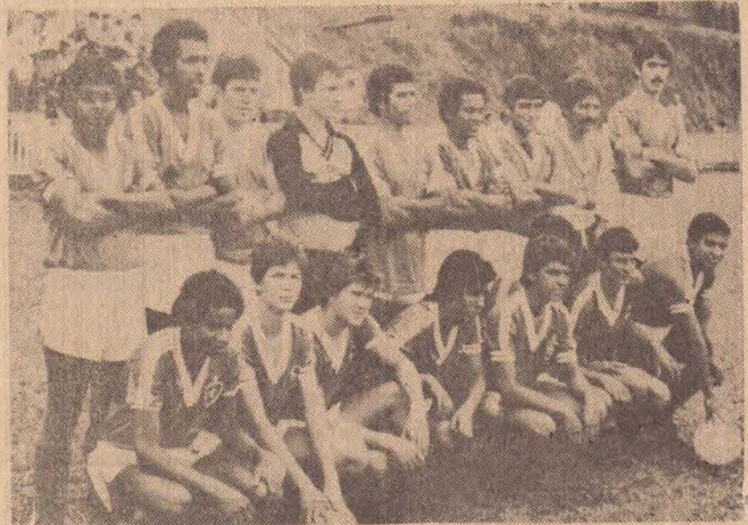
Equipe do G.E. Piqueroibense, vice-campeã.