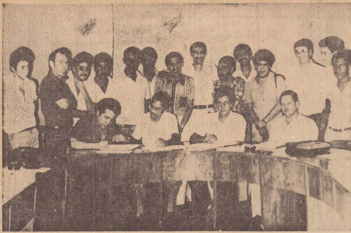
Um flagrante da reunião de ontem