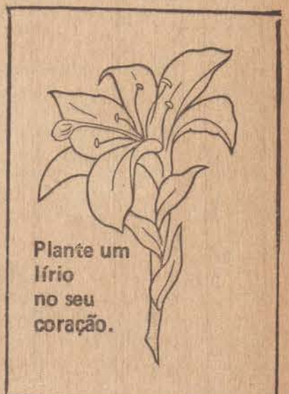
Plante um lírio no seu coração.

Sebastião estava na casa de Ramon e ao deparar com o amigo caído no chão do banheiro, ocorreu ao PSM, mas o jovem faleceu a caminho e seu corpo foi removido para o necrotério da Santa Casa local.