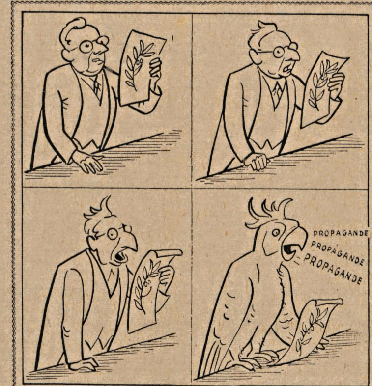
Gráfico de las conferencias y congresos pacifistas al uso.

del asesinato de Layret. La impresión que sufrimos todos los compañeros fué emocionada y sentida. De nuestros labios brotó una exclamación dolorosa. ¡Pobre Layret! ¡Pobre Layret! El golpe fué rudo para quienes morábamos en las bodegas del Giraldal. Sabíamos que con Layret perdíamos un defensor de primera calidad, un amigo desinteresado y un hombre honesto y bueno. Tampoco se nos escapaba la magnitud que iba tomando la represión. La estúpida y criminal empresa de descafeinar al sindicalismo revolucionario había empezado y que muchos compañeros seguirían su fatal camino. Pensábamos: Si se han atrevido con un hombre de las desgraciadas condiciones físicas de Layret, que no podía valerse de sus piernas; con un hombre de su representación, de su crédito y mérito, ¿qué nos harán con los simples militantes y trabajadores organizados? Así fué. El desenfreno vesánico de las autoridades cobró un inusitado dinamismo. Centenares de víctimas fueron inmoladas por el mismo procedimiento. Los militantes más agredidos de la C.N.T. fueron pagando su tributo de sangre. La plutocracia (Pasa a la página 3)