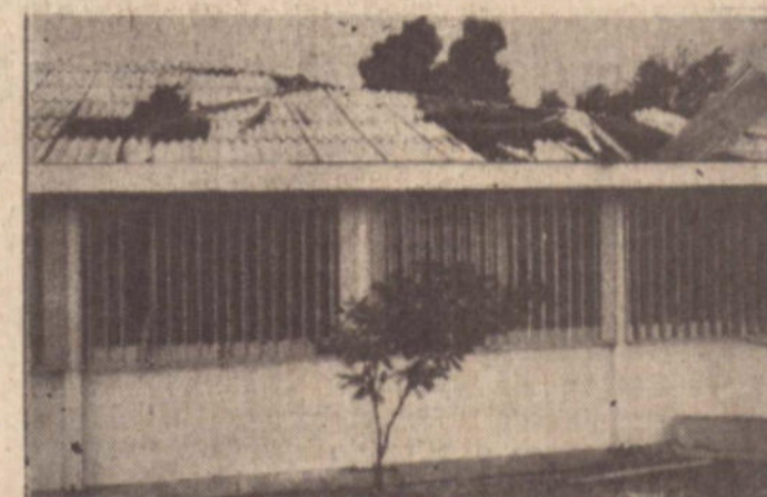
Uma grande área da cobertura de brasilite das duas salas de aulas foram atingidas pelas folhas de alumínio e caibros do telhado da cantina levados pela ventania.

Observou, a respeito, o Senador Lenoir Vargas: — Os municípios, sobretudo os de Santa Catarina, sempre têm um traço humano que precisa ser considerado e resguardado.