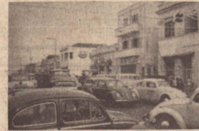
O trânsito conturbado da Av. Brasil, também está merecendo atenção especial do DETRAN.