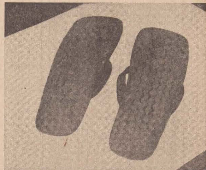
O par de chinelos deixado por um dos assaltantes, no asfalto.

Por sua vez, o presidente do Sindicato do Comércio Varejista de Combustível e derivados de petróleo de Minas, Fabio Coutinho Brandão, confirmou que "há falta geral de diesel no Estado".