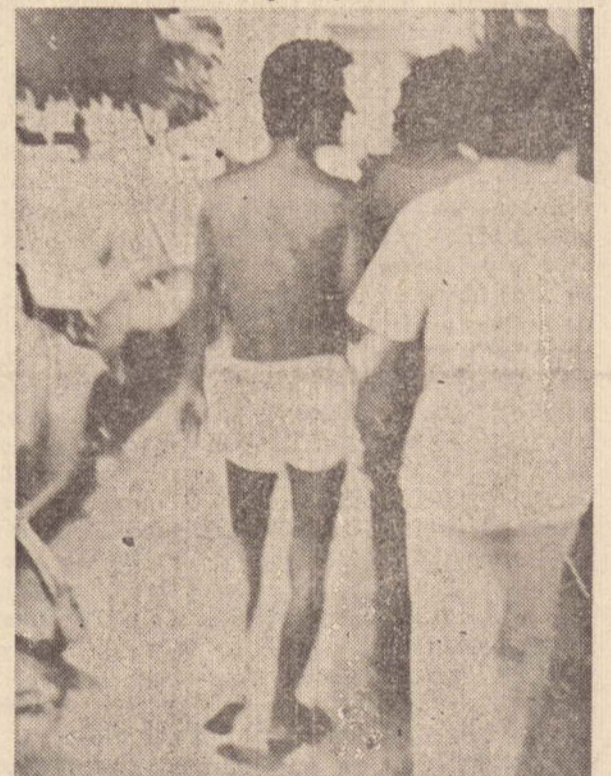
Teve até quem aproveitou para dar um passeio mais à vontade.

Agora que você já sabe alguma coisa, aproveite bem este verão de um país como o nosso... muito tropical.