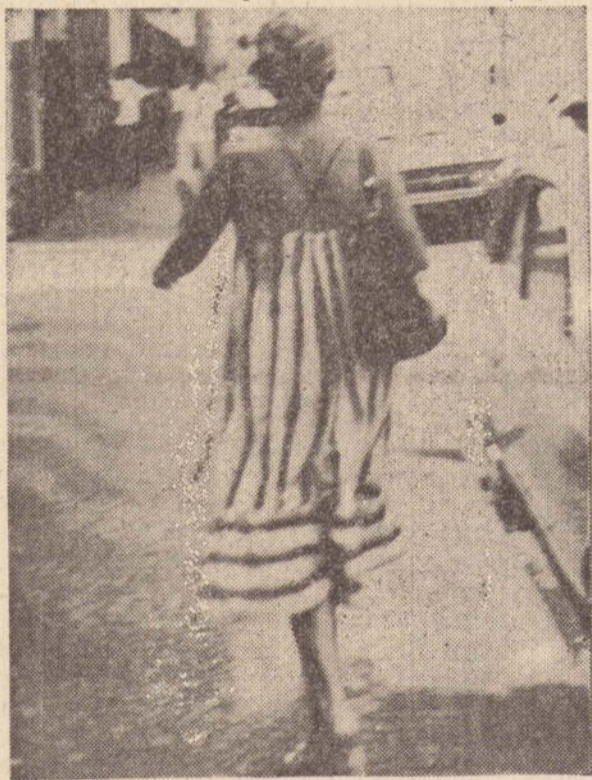
Vestido mais folgado, um pouco mais decotado é a moda das mulheres para enfrentar o calor.

Até mesmo os passelos de bicicleta, (que