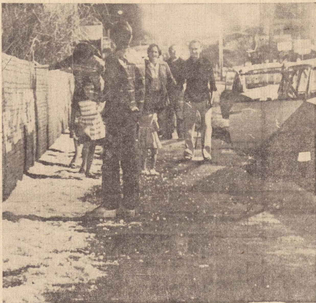
A população ficou surpresa com o fenômeno.

o centro urbano. Os supermercados da Avenida Presidente Vargas tiveram que fechar portas antes do horário comercial porque as chuvas invadiram o estabelecimento, causando prejuízos nos estoques. A chuva de granizo durou 15 minutos, isto é, das 17 e 5 às 17h20. As vidraças de várias casas, estabelecimentos comerciais e prédios públicos foram duramente atingidas.