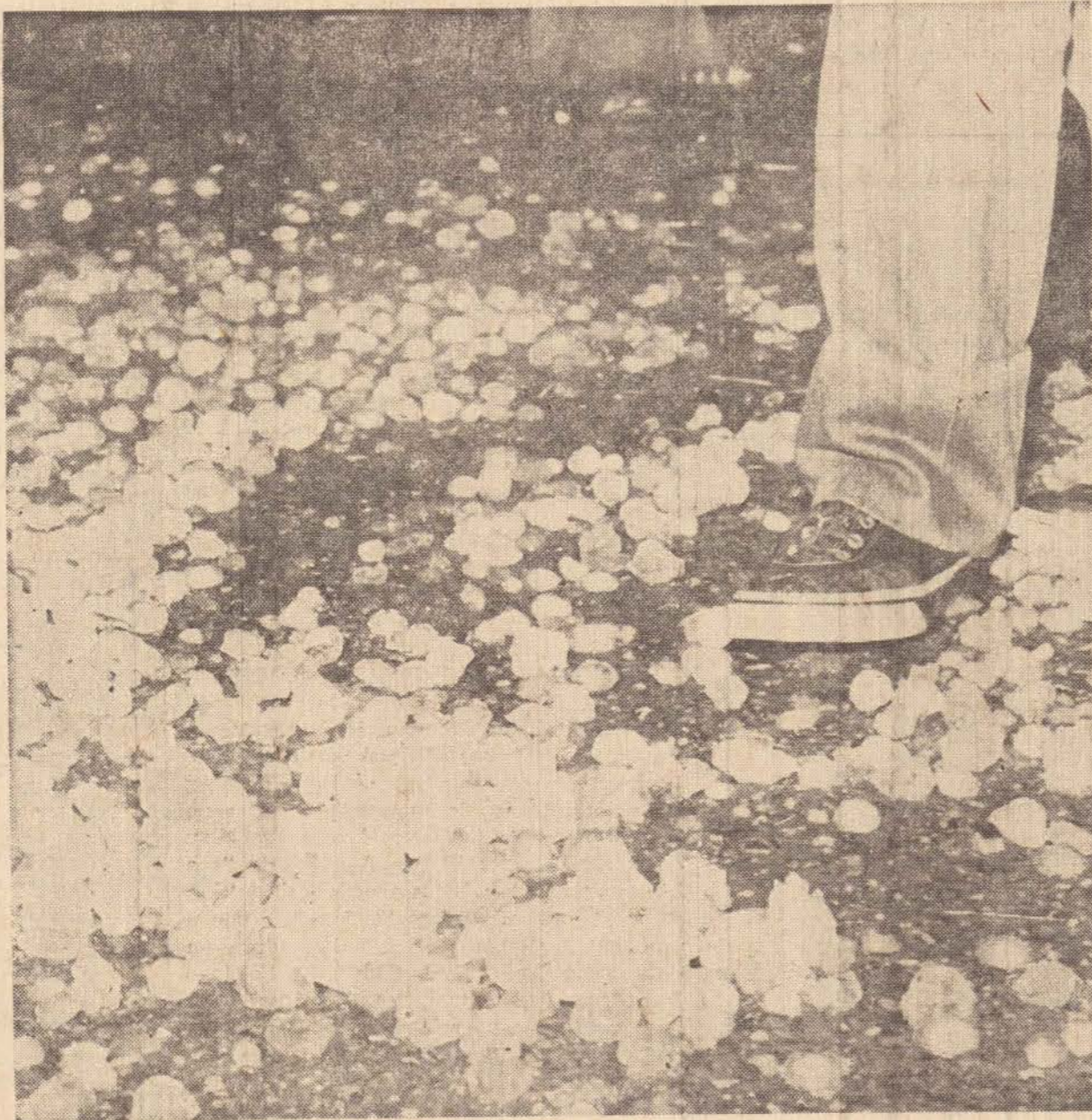
As pedras de granizo tinham o tamanho de um ovo de galinha.