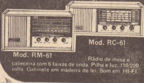
Mod. RC-61 Rádio de mesa e cabeceira com 6 faixas de onda. Pilha e luz, 110/220 volts. Gabinete em madeira de lei. Som em HI-FI. Mod. RM-61 Rádio de mesa e cabeceira com 6 faixas de onda. Pilha e luz, 110/220 volts. Gabinete em madeira de lei. Som em HI-FI.