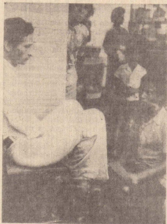
O engraxate, um pulo para a malandragem ou início sério de garantir a subsistência.

De agora em diante não faça mais conta de nada.