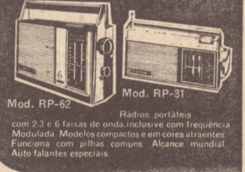
Mod. RP-62 Radios portáteis com 2,3 e 6 faixas de onda, inclusive com frequência Modulada. Modelos compactos e em cores atraentes. Funciona com pilhas comuns. Alcance mundial. Auto falantes especiais. Mod. RP-31 Radios portáteis com 2,3 e 6 faixas de onda, inclusive com frequência Modulada. Modelos compactos e em cores atraentes. Funciona com pilhas comuns. Alcance mundial. Auto falantes especiais.