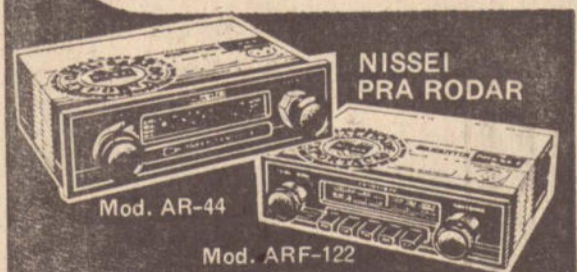
Mod. AR-44 NISSEI PRA RODAR Mod. ARF-122