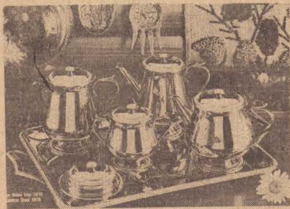
APARELHO P/ CHÁ E CAFÉ ITACOLOMY MERIDIONAL

Deixe a MERIDIONAL entrar em seu lar, aproveitando a promoção de nosso aniversário no comércio de Presidente Prudente. -Final, 35 anos é uma data que deve ser comemorada com muita figura.