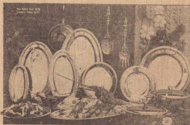
BAIXELA ITACOLOMY MERIDIONAL