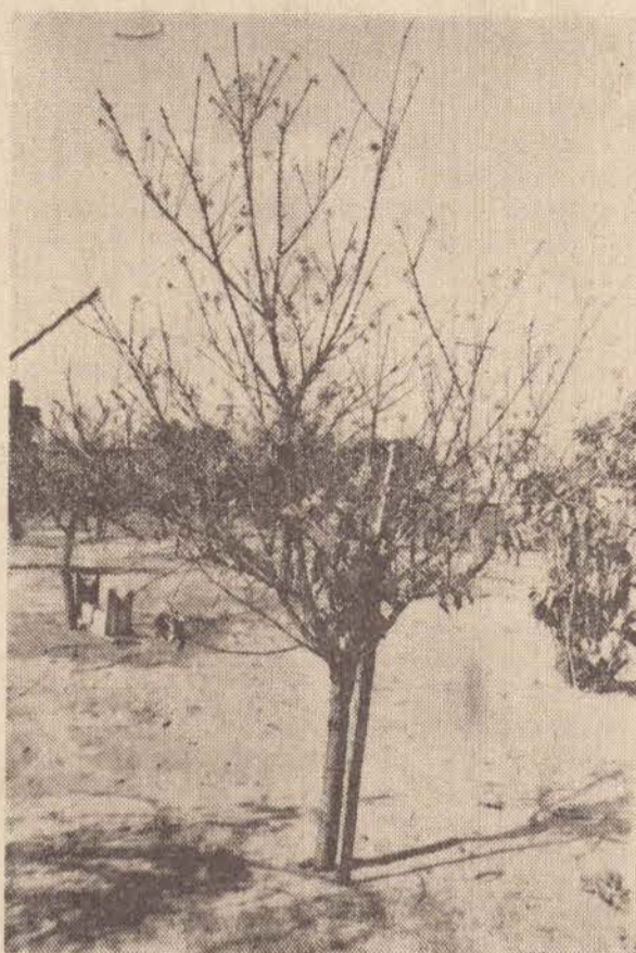
Uma das cerejeiras começando a florir

A Praça das Cerejeiras, fica próximo do seminario.