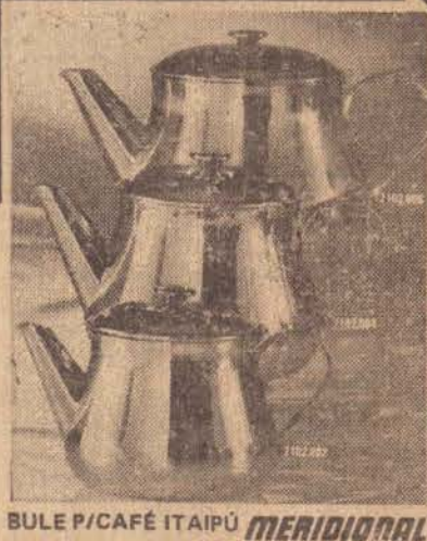
BULE P/CAFÉ ITAIPU MERIDIONAL