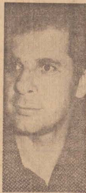
de bancários interessados em lutar pelos seus direitos" — afirmou.

O Sindicato dos Bancários de P. Prudente, promoverá amanhã, a partir das 20 horas uma assembleia geral da classe, tendo como local o Clube do Banespa. O objetivo é discutir a campanha salarial de 1981.