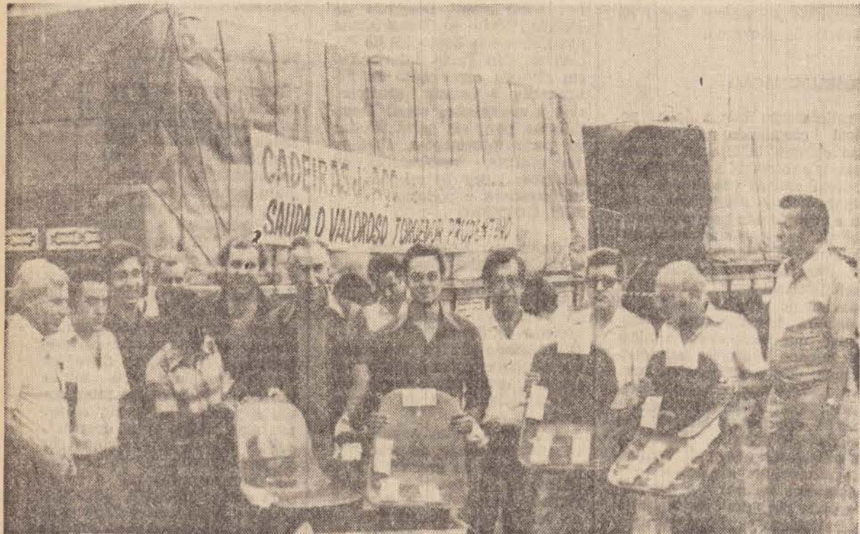
O prefeito foi ver a qualidade das cadeiras de aço.

Para mostrar que a construção do "Prudentão" é uma realidade, e que a obra do estádio, embora lenta e de acordo com os poucos recursos da municipalidade, está em andamento, a Prudenco promoveu ontem passeata com três caminhões que transportaram de Maringá para Pres. Prudente as primeiras 1.500 cadeiras de aço que serão instaladas no setor nobre.