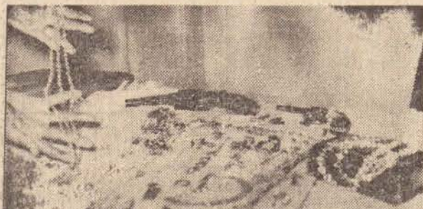
O SEI e o PTM, em trabalho conjunto encontraram jóias furtadas e apreenderam dois revólveres com os bandidos.