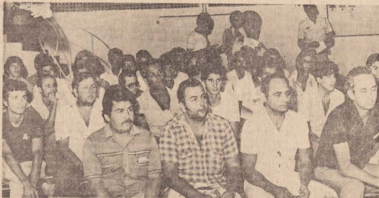
Flagrante colhido durante a realização do Congresso Técnico

No proximo final de semana teremos inicio da repescagem, onde mais duas equipes estarão se classificando para a fase final: Jogos de Sábado — 14:30 hs. — Colorado x Alegria — 16:00 — hs. — Beira Rio x Santa Cruz — Domingo 8:00 hs. — Mococa x Internacional 9:30 hs. — Comercial x Cruzeiro.