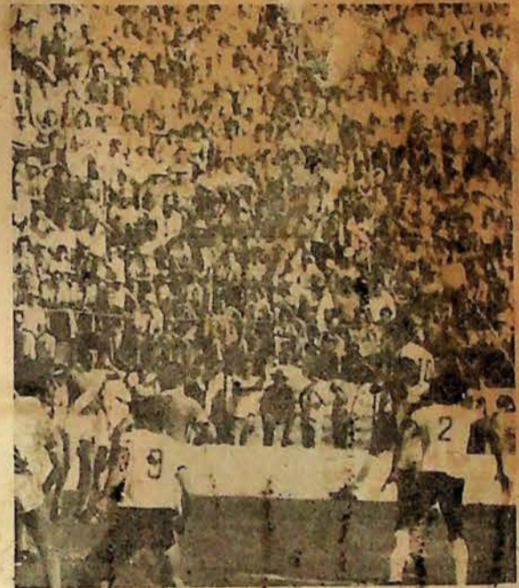
O Parque São Jorge deverá receber amanhã à tarde uma grande massa torcedora p/ assistir Corinthians PP x Barretos EC tomando as suas dependências como mostra a foto.