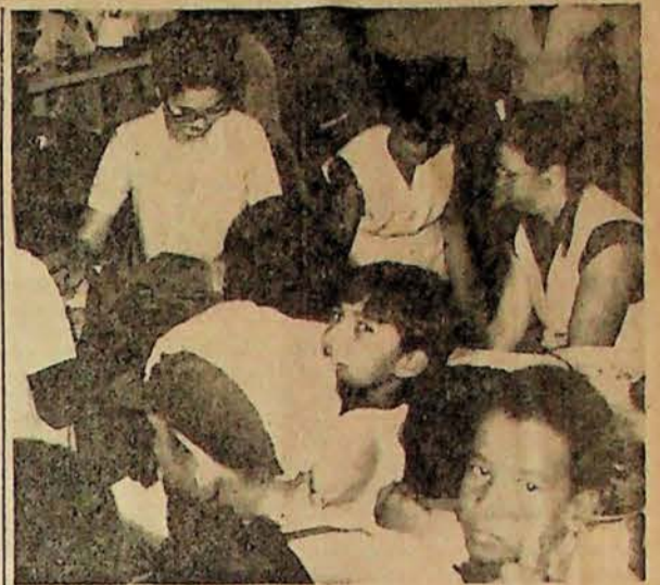
Ontem cedo na Escola Estadual de Primeiro Grau do Jardim Regina, o encerramento da Semana da Merenda Escolar. Diversas autoridades compareceram.

E quem tem padecido com isso são os alunos, que nem condução até a porta da escola, dispõem pelo menos na ida, porque na volta o ônibus circular da Empresa Brasileira, para defronte ao colégio, mas na ida, ou seja, sentido cidade-bairro, os alunos ficam há mais de duzentos metros quando o ônibus então adentra a Rua Roberto Simonsen, em direção a Faculdade do Estado.