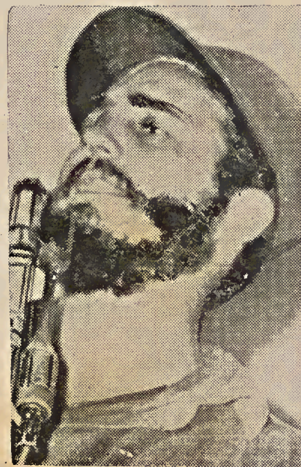
Fidel Castro, ganador de una Revolución que se le pierde en las manos

El realismo liberador de Maquiavelo culminó en un dramático contrasentido, que fué uno de los grandes contrasentidos del Renacimiento. Pues la libertad que éste postula es la del fuerte, la del príncipe dominador, símbolo personal del que será más tarde personal dominio del Estado. Al divorciar a la política de la ética, Maquiavelo inaugura una filosofía política racional; pero, esta política racional termina en otro contrasentido, pues ella habrá de estar más tarde al servicio de todas las expresiones irracionales del romanticismo hasta culminar en los actuales totalitarismos en auge. Y he aquí como —la historia tiene sus ironías— de un punto de arranque anti-mítico, venimos a parar a una mística del Estado, a lo que Ramiro de Maeztu denunciara como «la herejía alemana», que es ya una herejía universal. Esa cosa técnica, formal; ese artificio administrativo, creado para dar a la