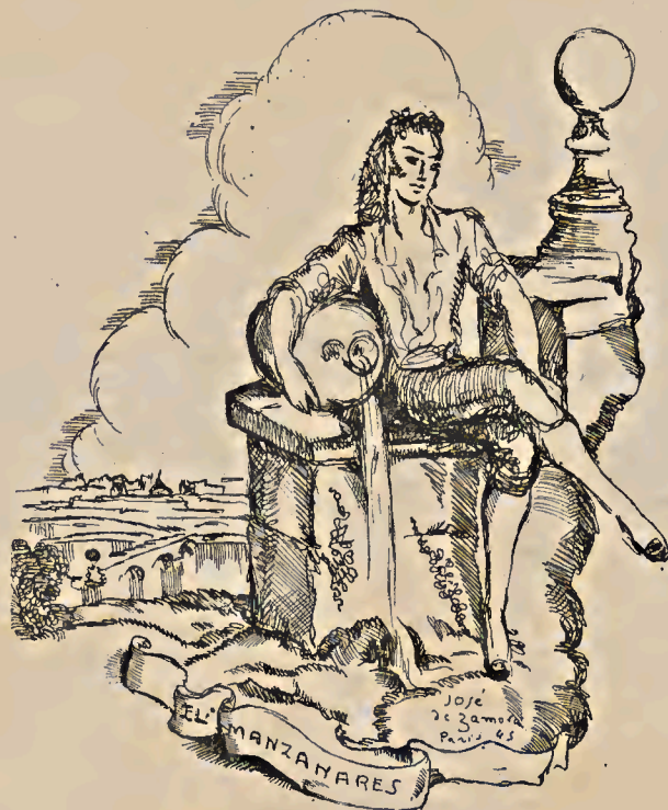
MADRID. — Alegoría del río Manzanares

Porque Marañón era un hombre de diálogo y de paz, los que hemos aceptado como una fatalidad histórica y como un imperativo del honor y del deber la guerra que no quisimos, la guerra que nos fué impuesta por la rebelión militar y la perfidia extranjera; los que seguimos en el destierro, con hambre de patria, solidarizados al dolor de España y de su pueblo, tenemos el triste presentimiento de que con el doctor Marañón desaparece uno de los puentes tendidos entre las dos orillas, uno de los hombres buenos, capaces de promover entre las tres Españas el diálogo, puente de las almas, que llevase a la comprensión, al olvido y a la reconciliación de todos los españoles. Los signos del cielo presagian, desgraciadamente para España, nuevos días de tragedia.