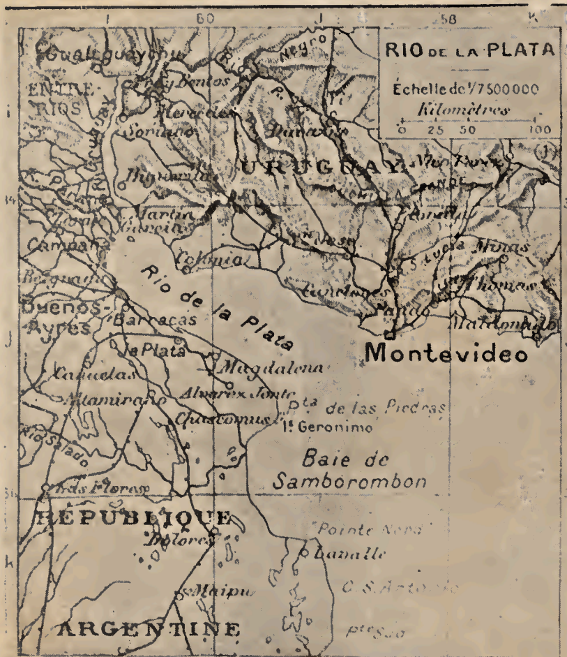
CONTINENTE AMERICANO. REGION PLATENSE

Si esta fusión de pueblos se realizara en Iberoamérica, visión que ya vislumbra Simón Bolívar en su célebre discurso de Angostura cuando clama por la unión del Virreinato de Nueva Granada y Venezuela (7) la sangría de España en los siglos XV y siguientes no habría sido inútil y los niños podrían deletrear sus primeras frases, sincera y justamente, con el precioso texto de Juan Zorrilla San Martín: «La América nació de una herida de gloria que esa España se hizo en el corazón... El descubrimiento de América, su conquista, su colonización, fueron un desgarrón de las entrañas de España; por esa enorme herida se derramó su sangre sobre todo el mundo, se fueron con ella muchas energías, que si hubieran quedado aquí —en España— en este hermoso territorio, aquí hubieran dado sus frutos, engrandeciendo a esta nación, dándole prosperidad, como prosperan materialmente los hombres infecundos, los que no parten su pan con sus hijos no nacidos. Hoy hace cuatro siglos ganó la raza hispánica, pero perdió la nación española; y lo que ella perdió fué