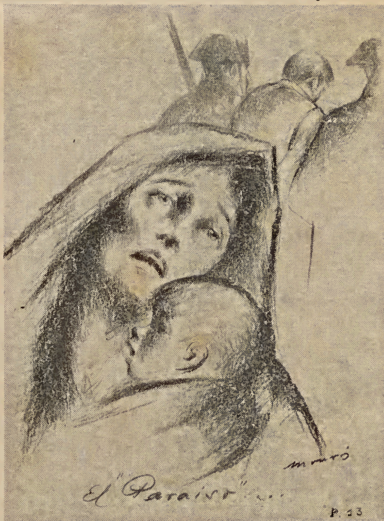
EL PARAISO FRANQUISTA: Magníficos dibujos publicados por la revista «Umbral», de Montreal (Canadá)

(1) Obsérvese la precisión con que P. H. U. cuenta el ciclo de vida del gaucho Fierro. (N.D.L.R.)