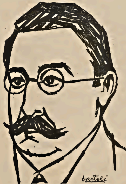
Figuras de América: José Enrique Rodó

(10) Dice H. G. Wells en su «Outline of History»: «Es un infortunio para la ciencia que los primeros europeos que llegaron a América fueran los españoles tan escasos de curiosidad, sin pasión científica, sedientos de oro, y llenos de la ciega beatería de una reciente guerra de religión. Hicieron pocas observaciones inteligentes sobre los métodos e ideas indígenas de estos pueblos primordiales. Los exterminaron y bautizaron; pero tomaron muy poca nota de las costumbres y de los motivos que cambiaban ante su ataque».