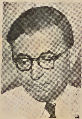
J. P. Sartre, escritor dado a la filosofía política

mecánica desligada de las antiguas fuerzas de la moral y de la religión, y que con la razón de Estado, proclama el laicismo y la autonomía del Estado. Este arte del Estado tiene por base un mero cálculo de los factores de fuerza disponibles. Es una política metódica en absoluto, objetivada y carente de alma».