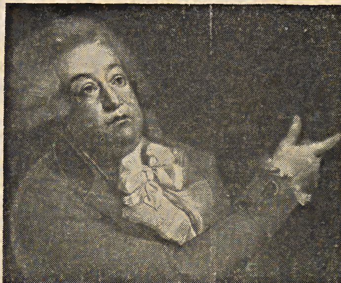
Mirabeau, político francés de la Revolución

Las páginas de la historia pretérita, la personal experiencia conquistada en los negocios públicos, los viajes que le ilustran sobre las costumbres de los países observados, los acontecimientos de los cuales es actor y espectador al mismo tiempo, son los elementos realistas, concretos, en los cuales fundamenta, este sutil florentino, su filosofía del hombre y de