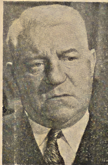
Figuras del cine francés.: Jean Gabin

En síntesis, novela rosa inmejorablemente ilustrada.