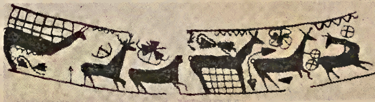
San Miguel de Liria, Barbarización del estilo (siglo II). Decoración de caza de ciervos con redes

barnizadas de negro — cuya forma aparece imitada en Belmonte — como las pintadas en la cerámica de Marión (Chipre) y Al Mina en el N. de Siria (136) y que en España tienen su equivalencia en la cerámica pintada de algunos de los platos de Fontscaldes en Cataluña, lo que acusaría un nuevo momento de la continua influencia griega en la cultura ibérica que se extendió hasta la zona limítrofe del verdadero territorio ibérico, en la parte oriental de Celtiberia.