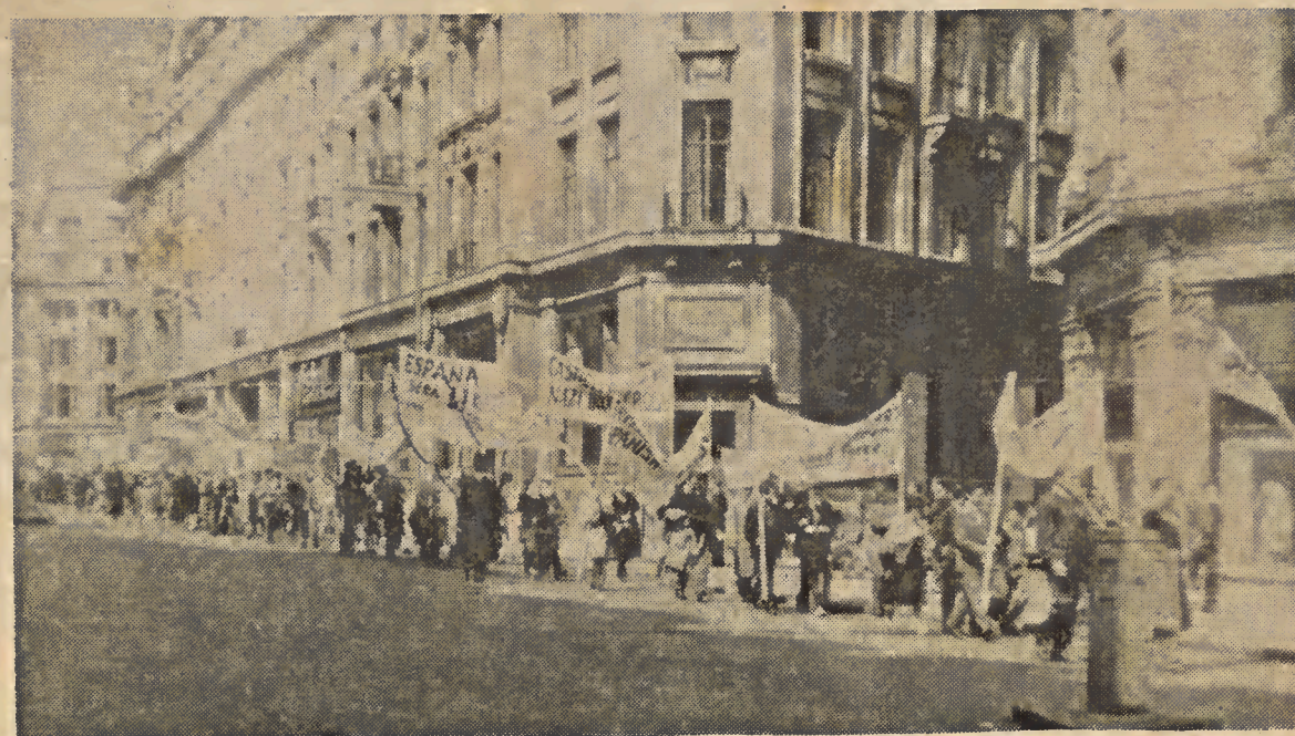
Manifestación en Londres contra la presencia del ministro franquista Castiella

«En las ciudades, esplendorosas moradas del hombre, se paladea el relente pestífero de una atmósfera contaminada. Las fábricas, los cuarteles y los monumentales edificios en que muere esclavizado el ser pensante y rumiante, se multiplican. Las humosas chime-