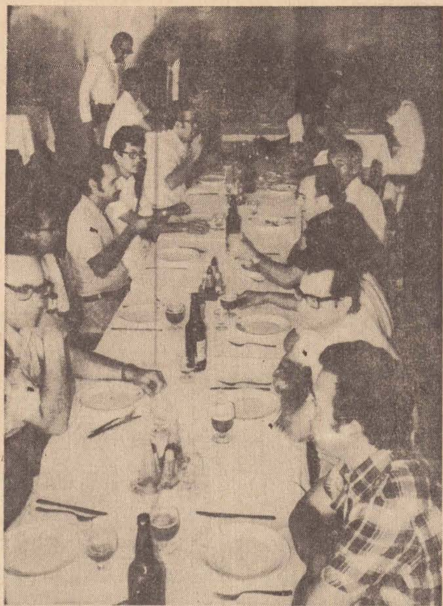
No almoço comemorativo, foi prestada homenagem ao mais antigo dentista do serviço escolar, de nossa região