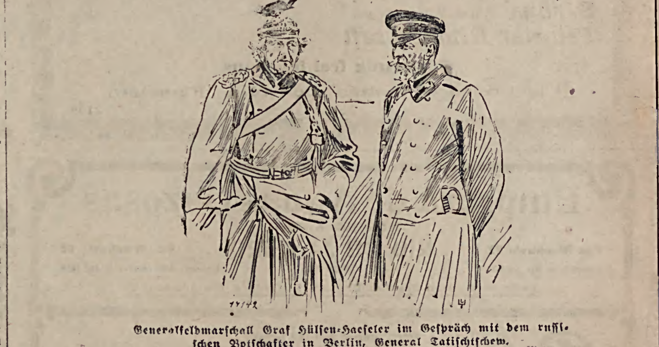
Generalfeldmarschall Graf Hülsen-Haeseler im Gespräch mit dem russischen Botschafter in Berlin, General Tatitschkin.

Die Bitten der Säuglinge. Von einer jungmutter wird den „Dresd. Nachr.“ folgendes geschrieben: „Möchten Sie wohl Folgendes zu Nutz und Frommen aller Mütter, die gleich mir, einen kleinen Säugling haben: Mein Kind ist sechs Monate alt, es ist immer gesund gewesen und gedeiht trotz der großen Hitze prächtig. Ich habe natürlich, da ich mein Kind selbst versorge und verpflege, Gelegenheit, mit anderen Müttern oder Kinderpflegerinnen und deren Schutzbefehlungen zusammen zu kommen. Und wenn ich die vielen anderen Kinder sehe, die blaß und erschöpft in den Kisseln liegen, kaum die Armechen heben können und widerwillig ihre Nahrung nehmen, wech ich mein eigenes Kind daneben jauchzen und krähen höre, dann ist mir stets, als ob die matten Augen der Säuglinge folgende Bitten aussprechen: „Zeige mich nicht ständiger Deinen Fremden und Verwandten, denn ich bin kein Wunderkind, und die fremden Leute schätzen meine ersten Lebensäußerungen gar nicht, weil sie kein Interesse dafür haben. Ich aber tue sie auf Geheiß der Mutter oder der Pflegerin, um möglichst bald Ruhe zu haben. Mache mit mir eine Kunststücke, das kann mein zarter Körper nicht vertragen, wenn es Dir auch Freude macht, so ist es mir nur unangenehm. — Herze und Kisse mich