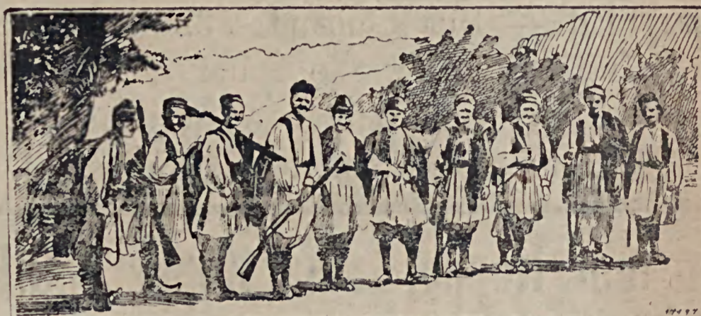
Von der serbischen Mobilisierung: Reserve-Infanterie

Für den Gemüsegarten ist jetzt der Haupt-Saat- und Pflanzmonat. Manche Saaten wurden schon im vorigen Monat ausgeführt und beginnen bereit