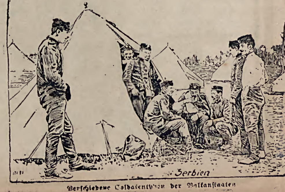
Serbien. Verfügbare Soldaten von der Balkanfronten