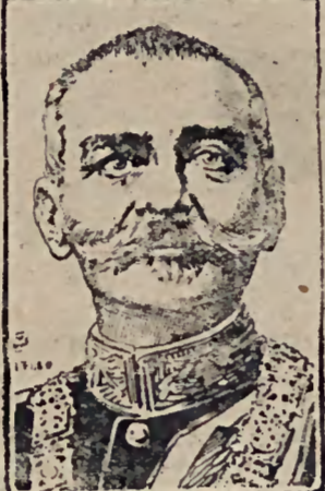
König Peter von Serbien.

fach himmlisch sei. Aber der Tag ist lang und die Unterhaltung war gleich null. Sommergäste waren noch nicht da und die Bauern verstand er nicht. Mit wem sollte er also reden? Gott sei Dank, daß heute mit dem Abendgange seine Frau kommen sollte! Mechanisch suchte er den Ehering, der in seiner Westentasche steckte, und ebenso mechanisch war er im Begriff, ihn an den Finger zu stecken, als seine Aufmerksamkeit durch eine junge, äußerst fessliche Dame erfangen wurde, die nicht weit von ihm aus dem Walde trat.