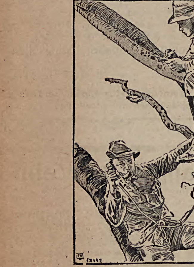
Die deutschen Pfadfinder in Berlin. Der diesjährige Pfadfindertag, an dem Pfadfindertroops aus allen Teilen Deutschlands nach Berlin gekommen sind, nahm am 4. Oktober seinen Anfang. Unter den verschiedensten Uebungen beanspruchte diesmal besonderes Interesse die der neu errichteten Telefonabteilung. Unser Bild zeigt einen Vorposten auf einem Baum mit festsitzender telefonischer Verbindung mit einer Hauptgruppe.

unserer Hand liegt es, aus dem Feinde einen Freund zu machen. Der Klerus und die Mode. Die Strafpredigt, die der Patriarch von Venedig, Kardinal Cavallarie, vor einigen Wochen gegen die heutige Damenmode gehalten hat, weckt sie zu wenig verächtlich und zu viel sehen oder ahnen läßt, war keine bloße rhetorische Uebung. Der venezianische Oberhirt meint es bitter ernst damit und hat seinem Klerus demgemäß Weisungen erteilt. Das sollte kürzlich eine Dame erfahren, die sich zur Firmung durch den Patriarchen eingefunden hatte. Sie war nach Latent begriffen ganz sitstam gekleidet in ein der Feier angemessenes Gewand, dessen Halsanschnitt, der sommerlichen Witterung entsprechend, mit einem Horststoff bedeckt war. Ein Mousignore, der mit prüfendem Blick durch die Reihen schritt, machte die Entdeckung, daß durch diesen Flor die natürliche Farbe der — sit venia verbo — Haut durchschimmerte, und erklärte darauf der transparenten Dame, daß in ihrer Anwesenheit der Patriarch die Fir-