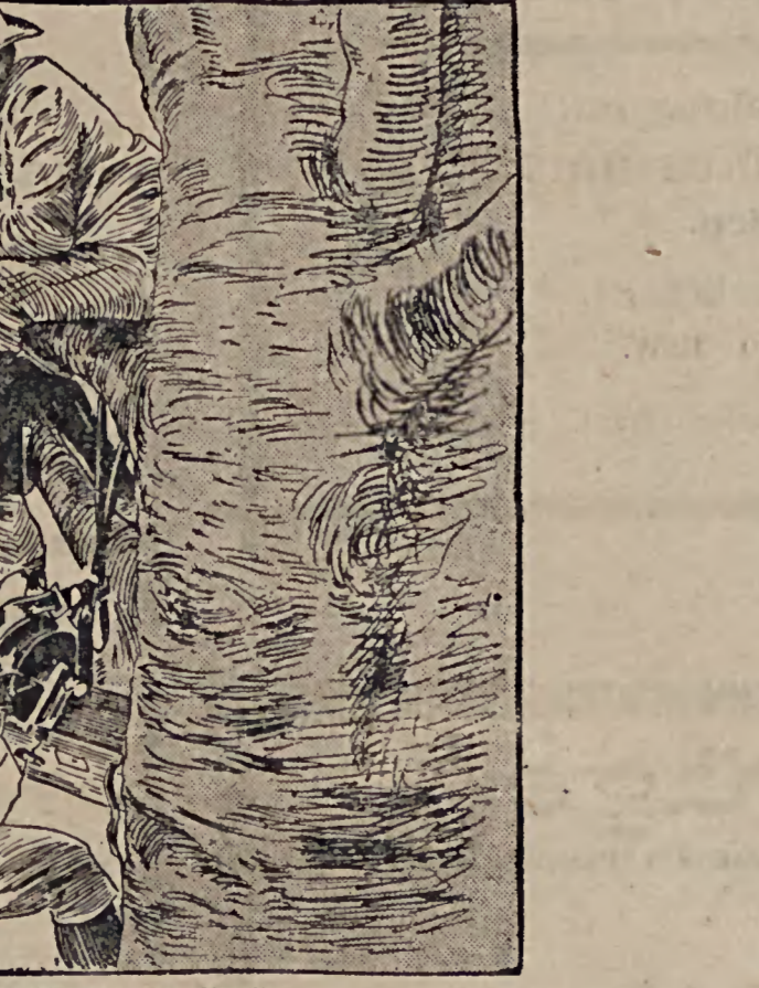
Die deutschen Pfadfinder in Berlin. Der diesjährige Pfadfindertag, an dem Pfadfindertroops aus allen Teilen Deutschlands nach Berlin gekommen sind, nahm am 4. Oktober seinen Anfang. Unter den verschiedensten Uebungen beanspruchte diesmal besonderes Interesse die der neu errichteten Telefonabteilung. Unser Bild zeigt einen Vorposten auf einem Baum mit festsitzender telefonischer Verbindung mit einer Hauptgruppe.