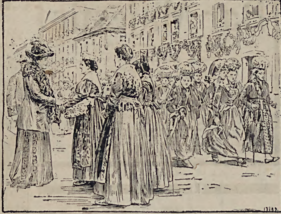
Ein Trachtenfest im Schwarzwald.