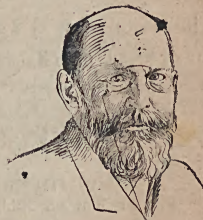
Prof. Emil Fischer, der berühmte Berliner Chemiker und Begründer der Biochemie, der am 9. Oktober seinen 60. Geburtstag feiert.

dies mit einem Glase Wein oder auch nur Wasser, etwas aufgelöstem Fleischextrakt und fein gewiegten Kräutern zu einer dicken Sauce, so daß das hineingegebene Fleisch eine ziemlich konsistente Masse bildet. Mit Salz und ein wenig Madeira abgeschmeckt, füllt man diese auf die obere Hälfte eines jeden Omelettes, schlägt die andere Hälfte über und serviert recht heiß.