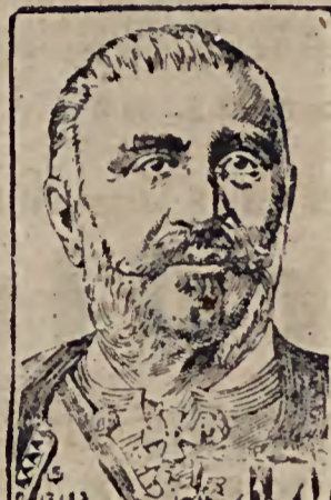
König Nikolaus von Montenegro.