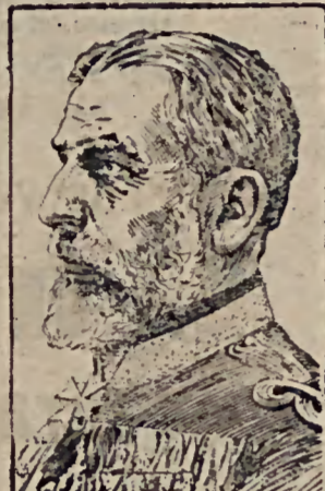
König Carol von Rumanien.