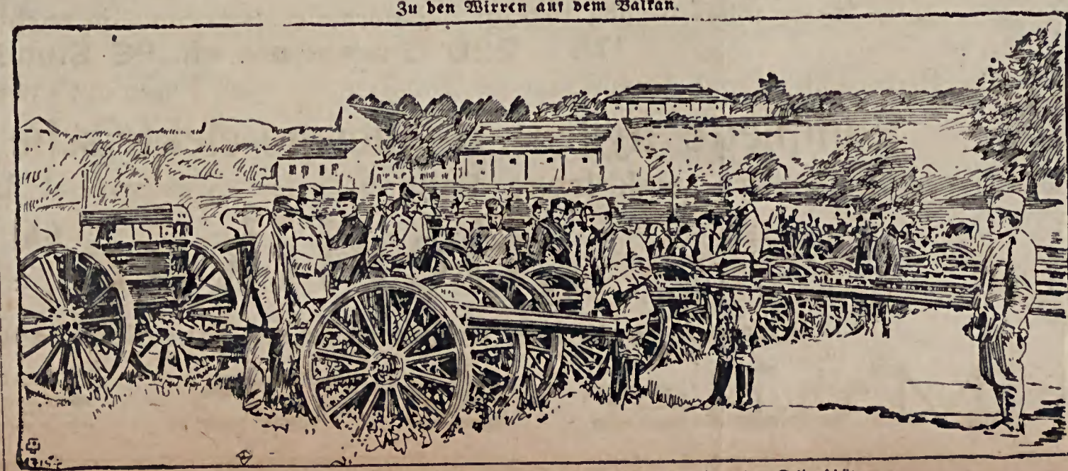
Seite von der letzten Mobilmaschine. Kontrolle und Abnahme des alten Feldgeschützes.

Deine, Mohamed, und Du mußt ihn machen lassen. Denn wer den Zaun zuerst errichtete, hat dies von seiner Seite aus getan und also auch die Nägel eingeschlagen. Mohamed als) läßt den Zaun machen, ihr beide aber, die ihr die Stadt um solch kleinen Handel erregt und in Unfrieden gebracht habt, anstatt Euch nachbarlich zu einigen — Ihr beide zahlt an mich je 100 Denare und erhaltet dafür jeder 25 Streiche auf den Fußsohlen. So gehehe es.“ Tief betrubt schlichen Ali und Mohamed heim; das Volk aber pries laut die Weisheit des Kalifen, der einen so verwickelten Streitfall so gerecht entschieden hatte. Stoßseufzer. „Ich habe nicht umsonst gelebt“, sagte ein Greis und betrachtete wehmütig seine gesammelten Steuerquittungen. Kennerin. „Wie gefallen Ihnen denn die Sachen von Strindberg?“ — „Ach, ich bleibe bei der alten Firma, ich kaufe schon zehn Jahre bei Hirschberg.“ Neuer Beruf. A.: „Von was lebt denn Ihr neuer Zimmerherr?“ — B.: „Der erfindet Namen für neue Wirtshäuser!“