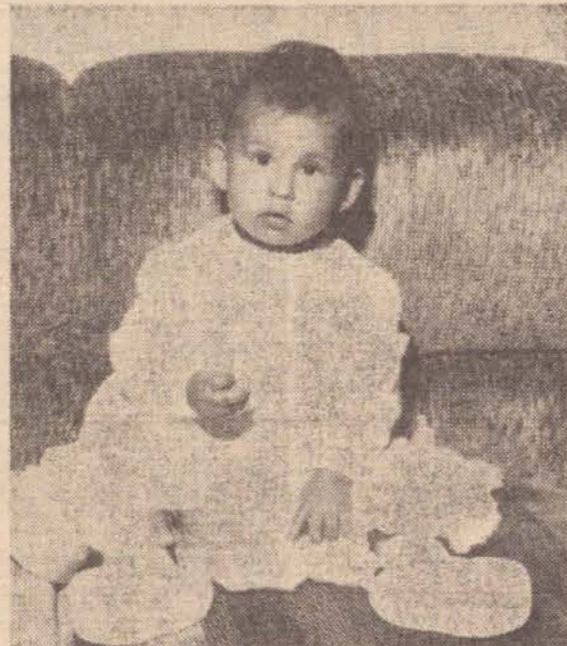
SOCIAL EM REGENTE

a entidade com campanhas tão significativas como esta desenvolvida no dia de Tiradentes.