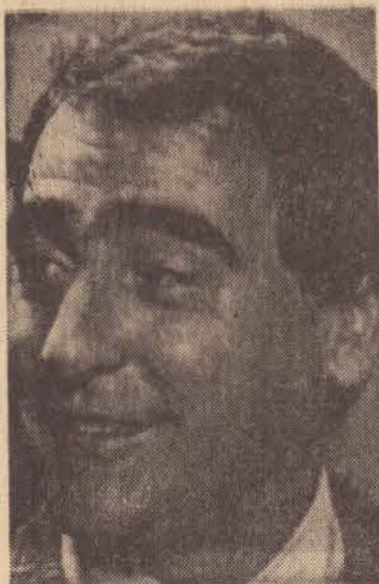
Mário Fofoca, tão bom quanto Beto Rockfeller