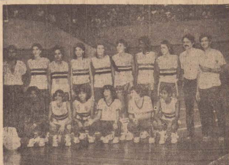
Se vencer, a equipe prudentina terá grandes chances de ser campeã do Estado

mo assim deverá jogar 10 minutos. Hoje, aproximadamente 100 torcedores deverão seguir a Bauru, para incentivar a Prudentina/Amepp. Os detalhes estão na última página.