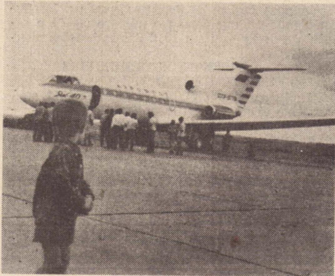
Quando o trijato russo preparava-se para deixar o aeroporto de Presidente Prudente, o garoto voltava-se para uma última vista do imponente aparelho.