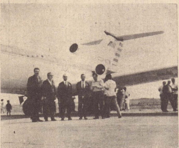
Dirigentes da VASP e da empresa estatal russa posaram ao lado do presidente da Câmara Municipal, ao lado do YAK-40.