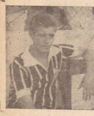
Bom dia Alemão

Podemos informar com absoluta segurança, que o Departamento Profissional do EC Corinthians, após o jogo com a Ourinhense, quarta-feira, dia 26 em Presidente Prudente, divulgará a lista dos jogadores considerados prescindíveis, e que deverão procurar club. Vários nomes estão sendo comentados, mas nada de concreto foi dado a conhecer à imprensa. Sabe-se que cerca de 4 jogadores, no mínimo, serão desligados do plantel de profissionais do Jerônimo do Interior.