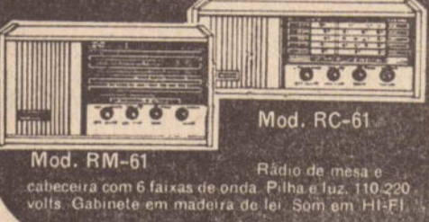
Mod. RC-61 Rádio de mesa e cabeceira com 6 faixas de onda. Pilha e luz. 110-220 volts. Gabinete em madeira de lei. Som em HI-FI. Mod. RM-61 Rádio de mesa e cabeceira com 6 faixas de onda. Pilha e luz. 110-220 volts. Gabinete em madeira de lei. Som em HI-FI.

— OMAR DISPENSADO — O atleta uruguaio Omar Caetano que já atuou diversas oportunidades pela seleção uruguaia e que foi o maior ídolo do Cosmos até a chegada de Pelé, acaba de ser dispensado. O Cosmos iniciou total reformulação em seu plantel, se preparando para a próxima temporada.