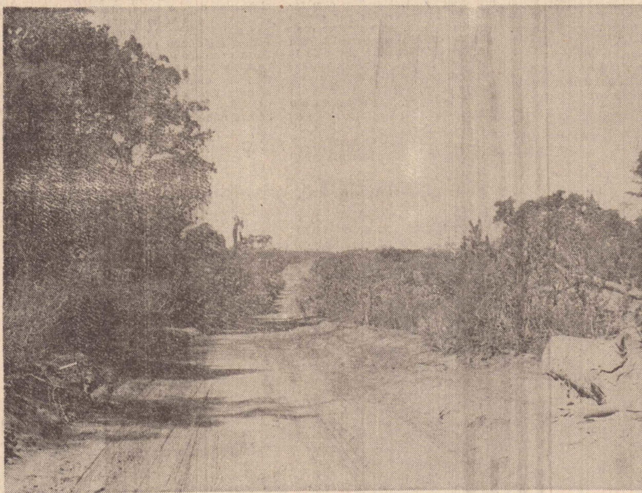
A rodovia T. Sampaio-Rosana, em fase de acabamento, protegerá a fauna e a flora.

Dos 115 mil alqueires que formaram de início a reserva, apenas 15 mil es-