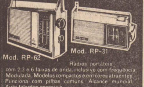
Mod. RP-62 Radios portáteis com 2,3 e 6 faixas de onda, inclusive com frequência Modulada. Modelos compactos e em cores atraentes. Funciona com pilhas comuns. Alcance mundial. Auto falantes especiais. Mod. RP-31 Radios portáteis com 2,3 e 6 faixas de onda, inclusive com frequência Modulada. Modelos compactos e em cores atraentes. Funciona com pilhas comuns. Alcance mundial. Auto falantes especiais.

— AULIO FARÁ PALESTRA — Acontecerá no dia 15 próximo, às 20h30m, Via Embratel palestra do presidente da Comissão Nacional de Arbitragem Aulio Nazareno, quando informará os critérios para a próxima Copa Brasil, ex-campeonato nacional de clubes. Todos os juizes que apitarão no certame, estarão presentes e logo após a palestra receberão por escrito os critérios para as arbitragens.