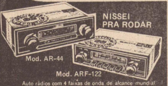
Mod. AR-44 Auto rádios com 4 faixas de onda de alcance mundial. Sintonia manual ou automática. FM/AM 49/31/25 ms. Potência de 5 watts, sem distorção e isento de ruídos e interferência. Totalmente transistorizado. Mod. ARF-122 Auto rádios com 4 faixas de onda de alcance mundial. Sintonia manual ou automática. FM/AM 49/31/25 ms. Potência de 5 watts, sem distorção e isento de ruídos e interferência. Totalmente transistorizado.

— TELEVISAMENTO DIRETO — O Brasil juntamente com o Chile, confirmou interesse em receber da Argentina imagens diretas dos jogos do campeonato mundial de 1.978. As imagens chegarão ao Brasil via Embratel.