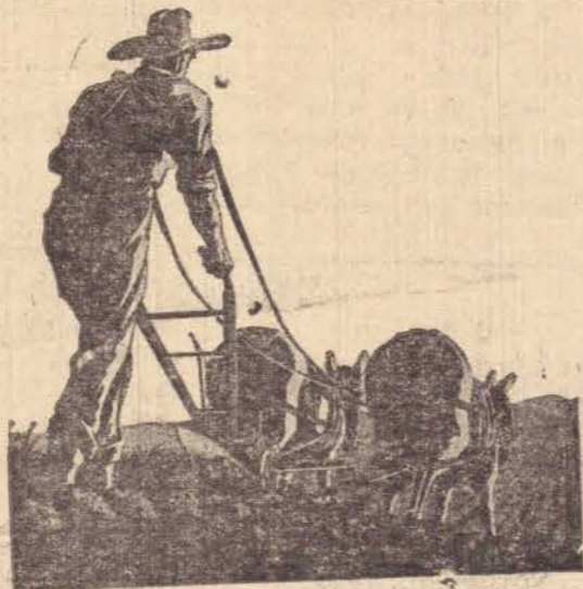
A principal atividade agrícola atingida com a seca é o preparo da terra com arados, para o plantio do mendoim e milho

São Paulo (Interpress) — A Central do Brasil contará brevemente com modernos vagões-escolas de tremamentos para seu pessoal ferroviário. O carro disporá de moderno equipamento de ensino audiovisual e o seu funcionamento está previsto para o próximo mês de setembro.