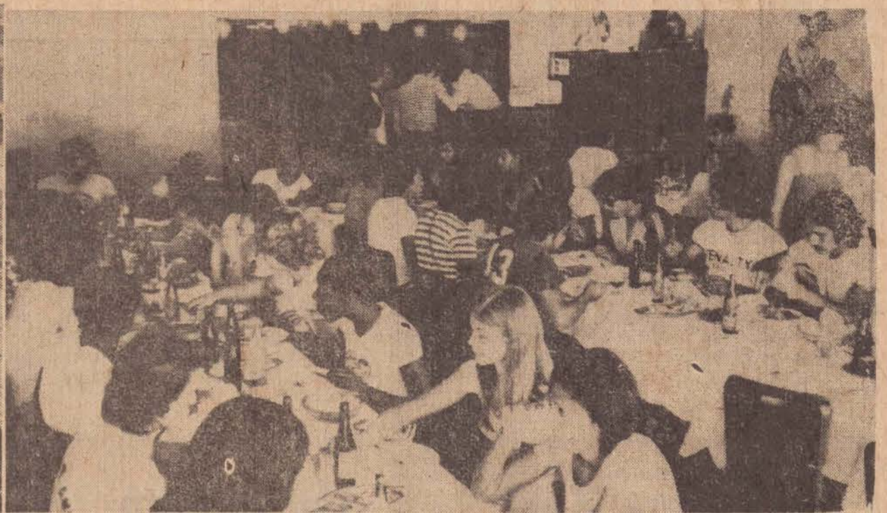
A delegação do Sesi chegou logo pela manhã e fez a sua primeira refeição num restaurante da cidade.