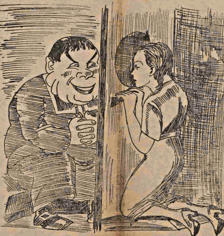
Confessando-se ao padre, a mulher entrega-lhe o dominio absoluto de sua casa e da sua consciencia