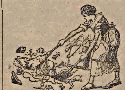
LATA DO LIXO