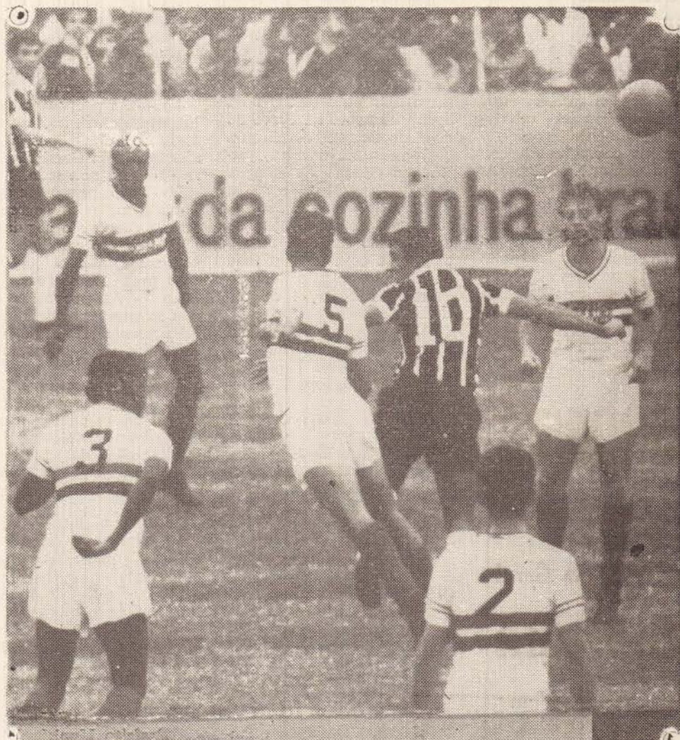
ATE ONDE FOI A "COVARDIA" DOS CORINTHIANS DE SÃO PAULO! VEJAM SÓ A FOTOGRAFIA:- CINCO CONTRA DEZ!... ASSIM NÃO ERA POSSIVEL!