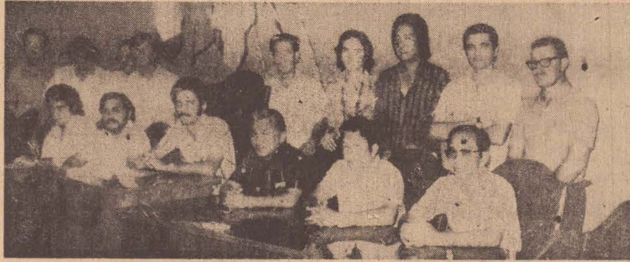
Um aspecto da participação no curso de vendas da Valmet, em Pres. Prudente.