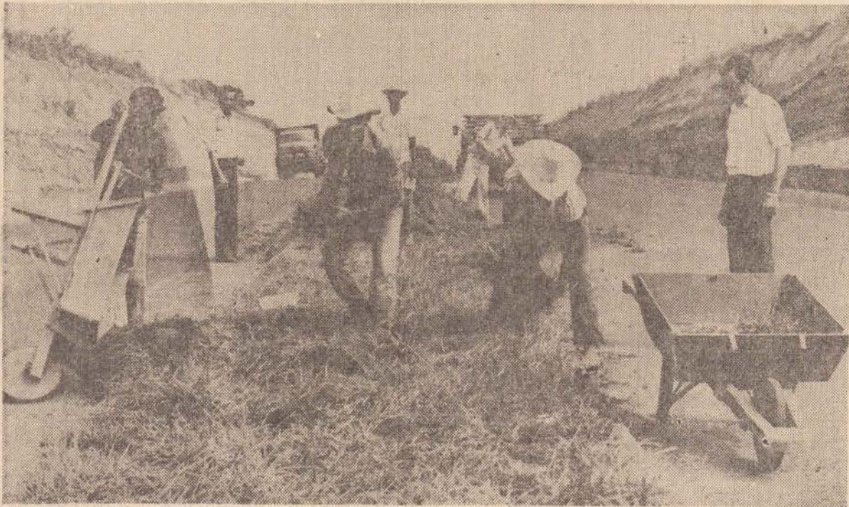
Operários da prefeitura executam o ajardinamento do canteiro central da Estrada da Amizade.