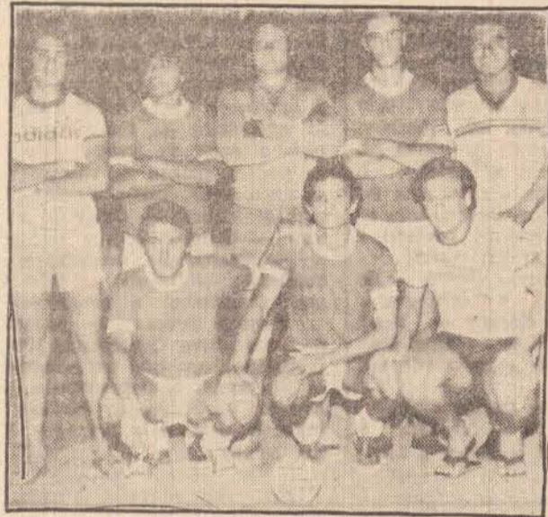
Nautico campeão de Reg. Feijó.