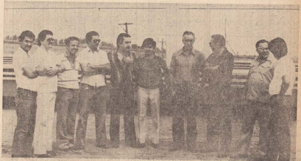
Diretores da construtora Esusa e o prefeito, visitaram a obra ontem pela manhã.

Toro negou-se a revelar onde estão os outros animais, contudo, admite-se que eles foram abatidos clandestinamente e vendidos a açougues da região.