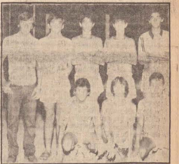
Equipe do Cruzeiro campeã "Dentão".