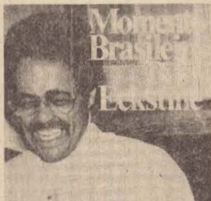
BILLY ECKSTINE — MOMENTO BRASILEIRO