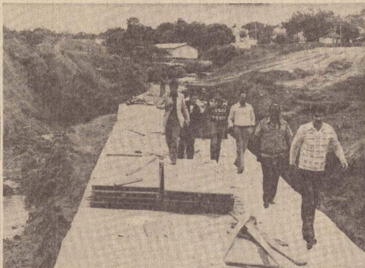
O prefeito caminha sobre a galeria localizada no vale do Tennis Clube, acompanhado de sua comitiva.