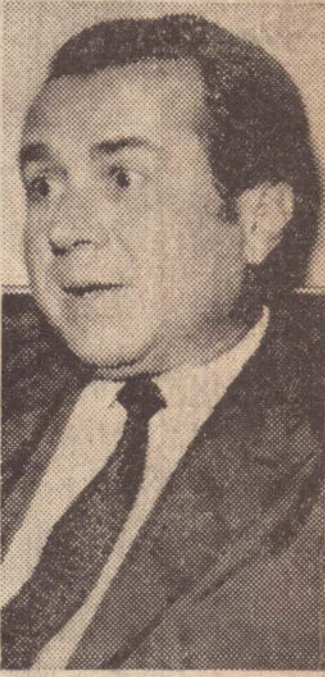
Na redação, o coordenador após o plano de instalação dos Escritórios Regionais no Estado, especialmente o de Pres. Prudente.